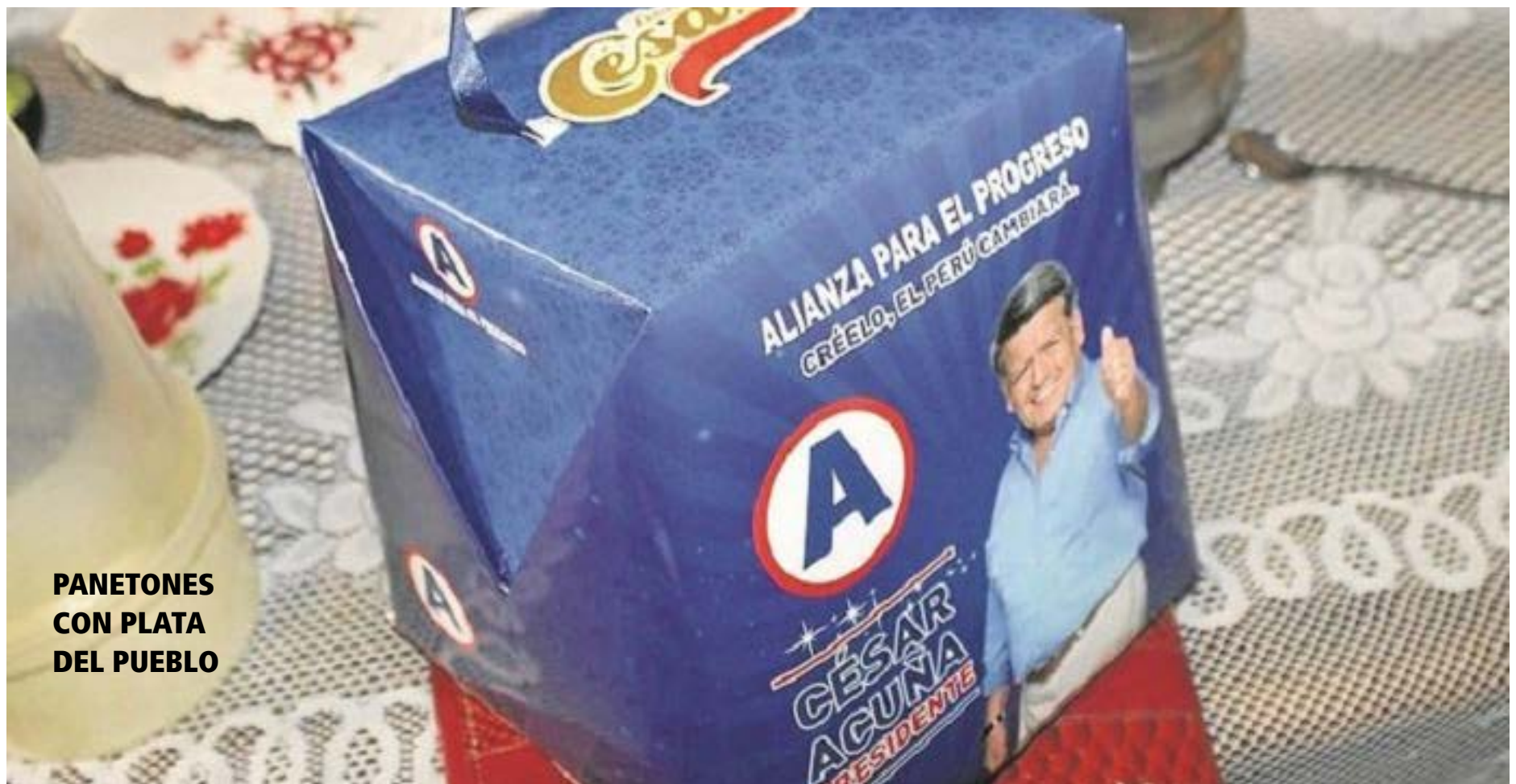
PANETONES CON PLATA DEL PUEBLO

UCV de Trujillo sigue repartiendo producto con fotografía del candidato pegalón