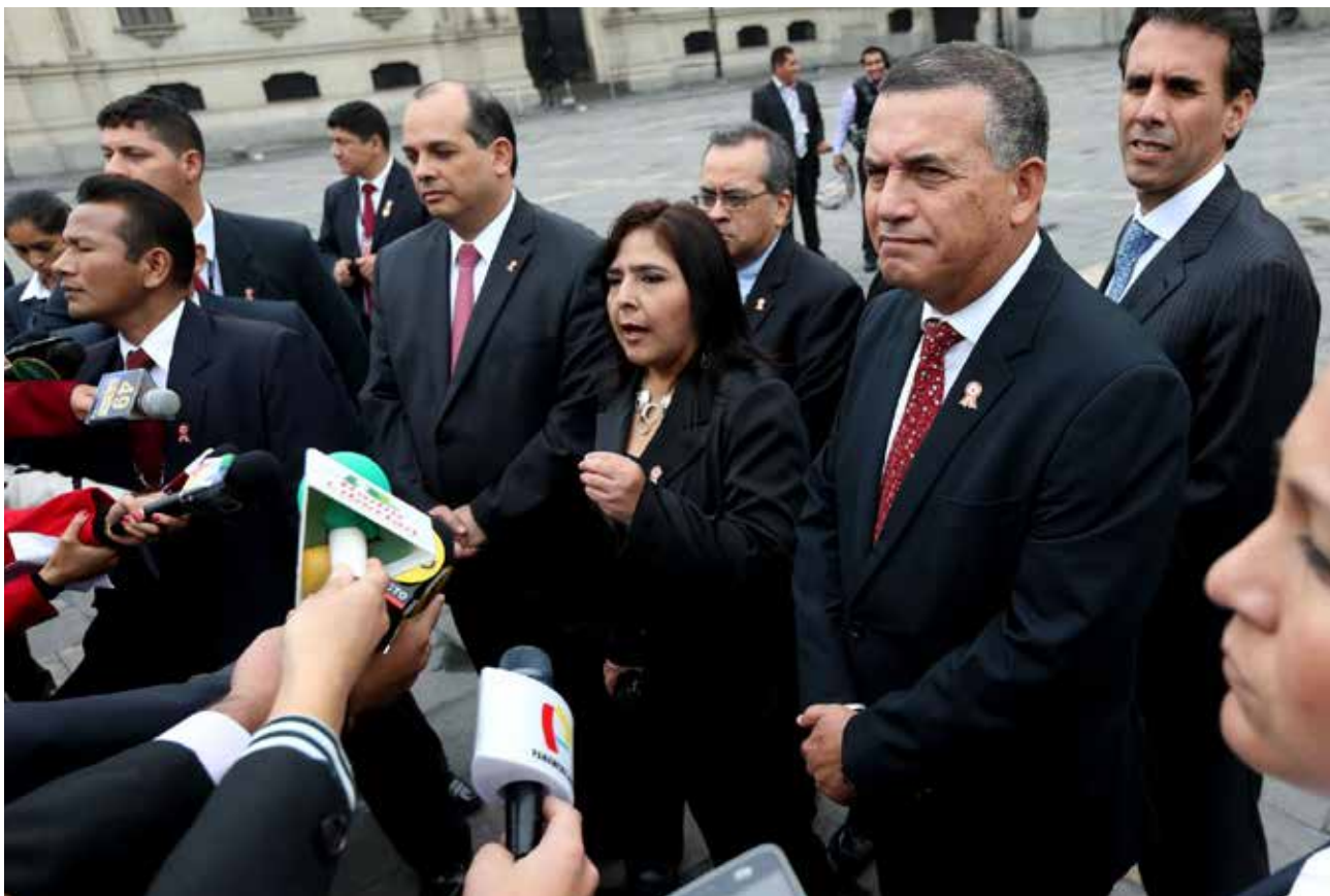
La caída del gabinete de Ana Jara marcó la debacle de este gobierno. Se dijo que era indestructible por la amistad de Ana Jara con Nadine Heredia.

En su opinión, la imposición de Solórzano como candidata a la presidencia del Congreso en el 2014 fue el factor que, a la larga, generó que el nacionalismo perdiera a varios de sus integrantes, y