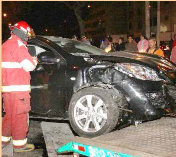
Beber en estado de ebriedad es riesgoso.