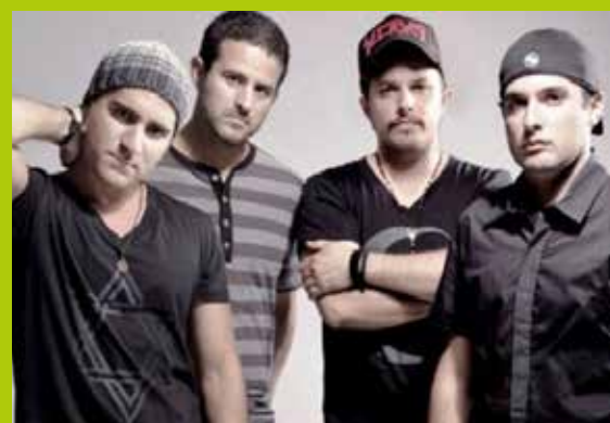
Rockeros quieren difundir su música.

(1987-1993), y "Cosby" (1996-2000) para seguir dando a la comunidad negra la oportunidad de protagonizar historias positivas. El camino que el artista abrió ha sido seguido por decenas de series como "One on One", "Everybody Hates Chris", "My Wife and Kids", "The Proud Family" y las exitosas "Empire" y "Blackish", aunque ninguna de ellas tuvo el mismo impacto.