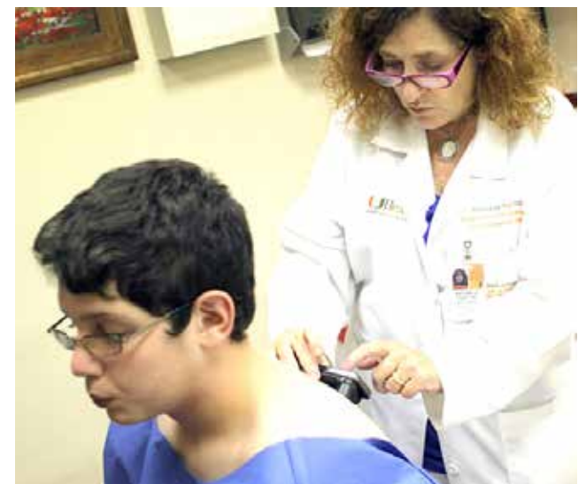
La dieta blanda es lo más indicado tras beber alcohol.

Si los cítricos no te irritan el estómago, son una buena alternativa en el desayuno. De lo contrario, otras opciones son el yogurt con plátano o granola con yogurt.