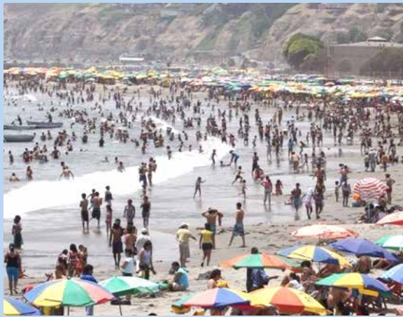
Hay playas que no son aptas para la salud.