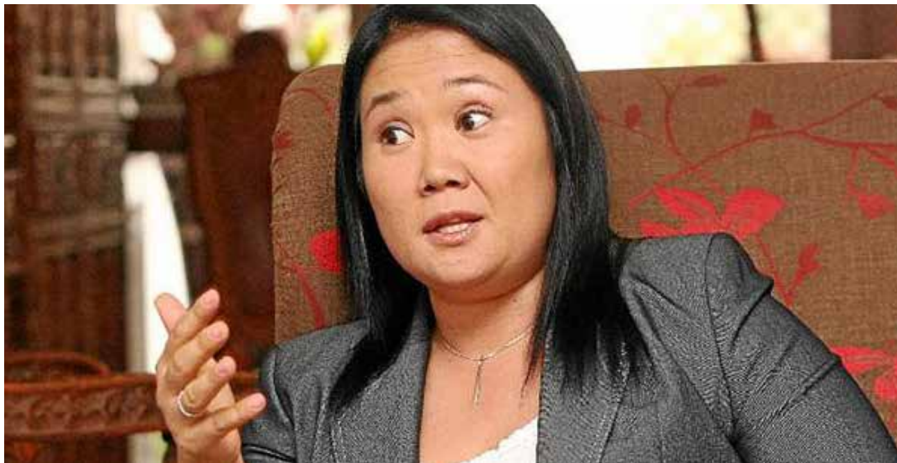
Keiko Fujimori con capacidad para maniobrar políticamente.