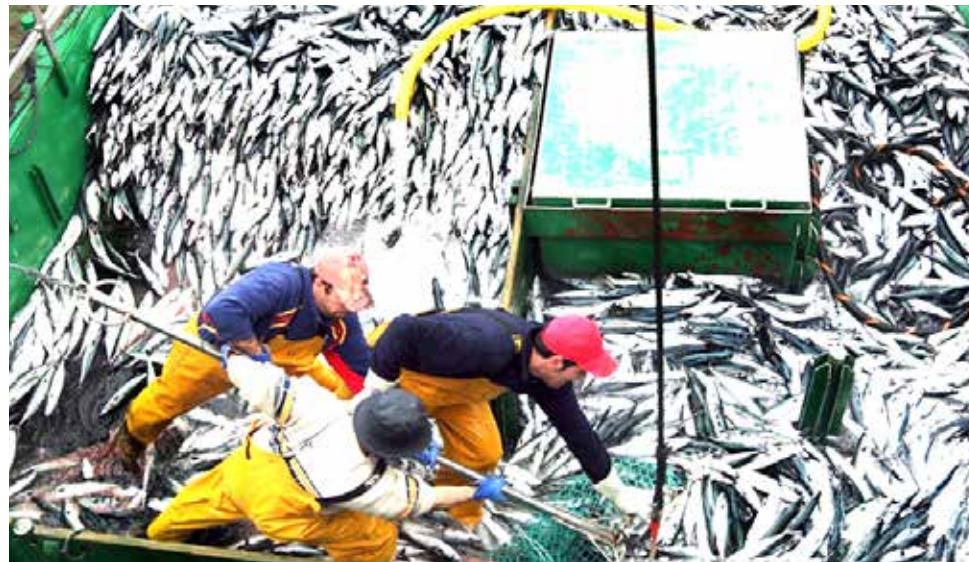
Se busca proteger el recurso anchoveta en el mar peruano.

La suspensión será de aplicación a la actividad