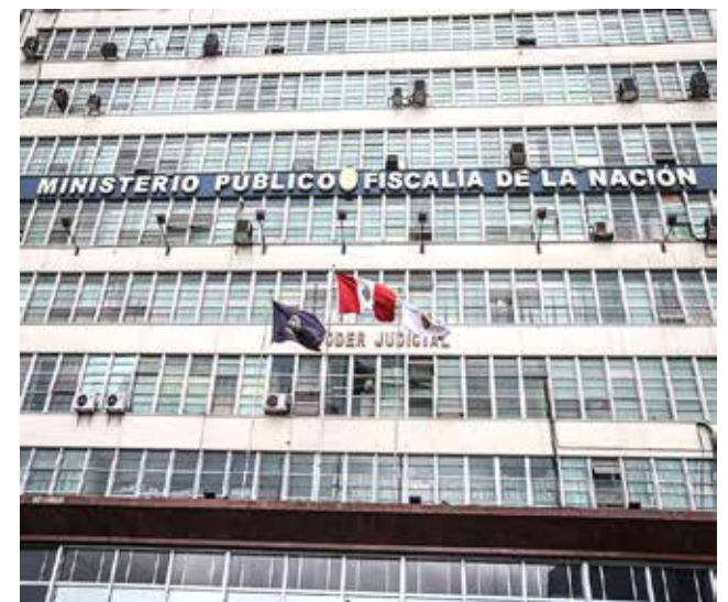
Ministerio Público logró que se haga justicia.