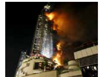
Famoso hotel en Dubái se incendió.

noce la causa del incendio, que ha cubierto al menos 20 pisos de los 63. Los escombros caen desde el edificio provocando pánico entre la gente. Los camiones de bomberos llegan hacia el lugar de los hechos. No se han reportado víctimas.