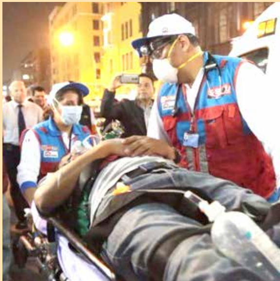
Médicos tuvieron trabajo fuerte en emergencias.

◉ POR INTOXICACIÓN ALIMENTARIA Y TRAUMATISMO