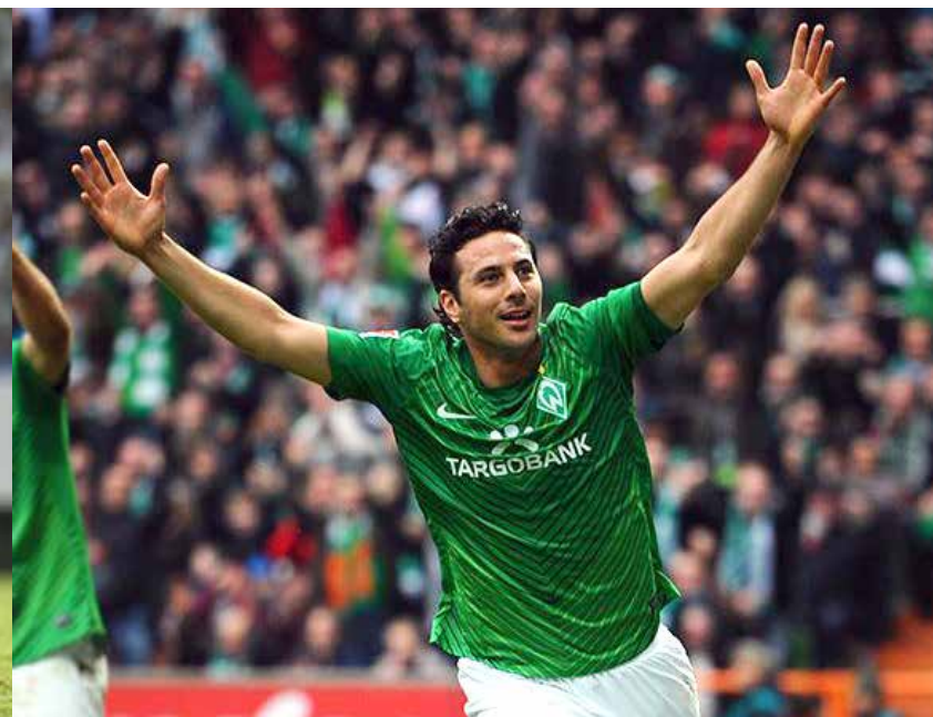
André Carrillo estaría a punto de abandonar Lisboa (Portugal) y Caludio Pizarro sigue cosechando elogios en Alemania, uno de sus goles en Werder Bremen fue considerado como el mejor de la Bundesliga.

gracias a su buen desempeño desde que arribó al Eintracht Frankfurt de Alemania.