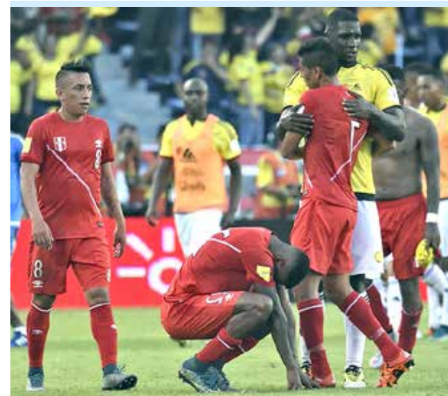
Selección peruana está en deuda con la hinchada.

Perú vs. Chile: El clásico del pacífico ratificó a Chile como una potencia mundial con un ataque demolidor.