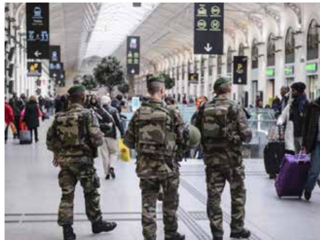
En Europa viven atemorizados por posibilidad de ataques terroristas.

En Bruselas, las celebraciones fueron anuladas después de que seis personas fueron detenidas el jueves por amenazas de atacar la ciudad durante las fiestas de fin de año. La capital francesa, aún en estado de shock por las masacres del 13 de noviembre (130 muertos), tuvo un enorme despliegue