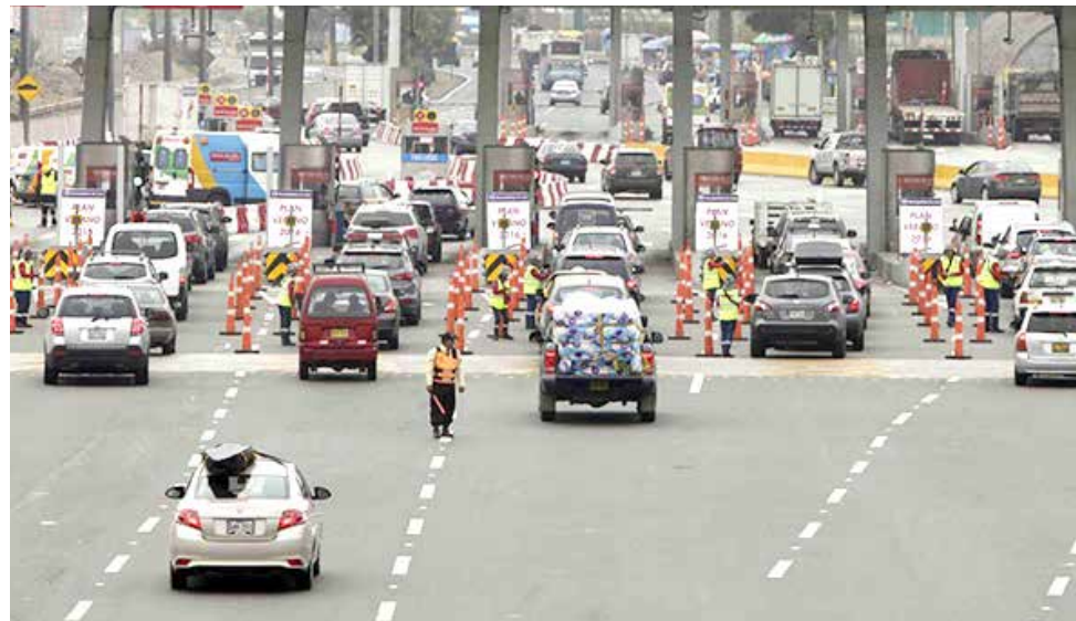
Conductores respondieron al llamado de la Municipalidad de Lima.

Para garantizar el éxito de este llamado, la comuna metropolitana, en coordi-