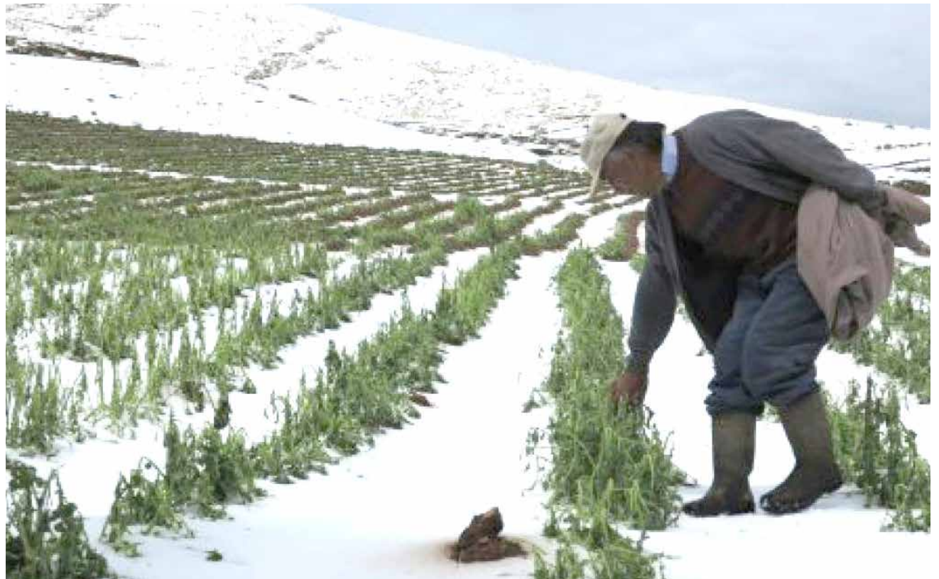
Granizada fue intensa. Agricultores son los más afectados en Junín.

Durante la declaratoria de Alerta Verde, que rige desde el pasado 23 de diciembre hasta las 08:00 horas del lunes 4 de enero, los accidentes de tránsito han sido uno de los eventos adversos que han demandado mayor atención en los servicios de Emergencia de los hospitales del Minsa.