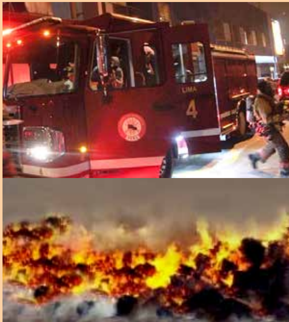
Bomberos se esforzaron para apagar incendio.

◉ FALTA DE AGUA IMPIDIÓ LABOR DE LOS BOMBEROS