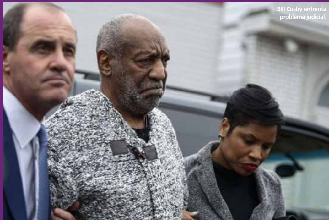
Bill Cosby enfrenta problema judicial.

Cosby, de 78 años, fue un pionero a la hora de romper barreras raciales y poner en el centro de sus comedias a familias negras acomodadas que se distanciaban de los estereotipos que dominaban la opinión pública. Así lo demostró en "The Cosby Show" -conocido en Latinoamérica como "El show de Bill Cosby" y en España como "La hora de Bill Cosby"-, la serie más vista de los 80 y que le catapultó a la fama. Entre 1984