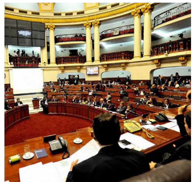
Congreso aprueba norma a favor de niños.

nueva norma, la ley del Congreso modifica un artículo del Código de los Niños y Adolescentes para incorporar que todos los menores, "sin exclusión alguna, tienen derecho al buen trato, que implica recibir cuidados, afecto, protección socialización y educación no violentas, en un ambiente armonioso, solidario y afectivo".