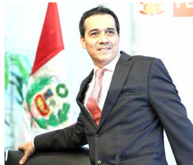
Alonso Segura, ministro de Economía y Finanzas.

De esta manera, la inversión pública del Gobierno Nacional (en formato presupuestal) registró los mayores niveles de ejecución al registrar un incremento de 23.9 por ciento en relación al 2014.