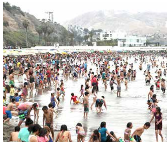
Familias acudieron desde la mañana a la playa.

Del mismo modo, tuvo gran demanda el negocio de alquiler de baños y servicio de taxi, en el primer día del año 2016.