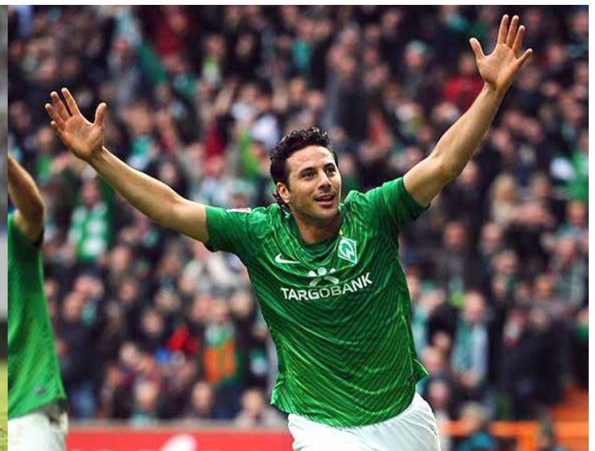
André Carrillo estaría a punto de abandonar Lisboa (Portugal) y Caludio Pizarro sigue cosechando elogios en Alemania, uno de sus goles en Werder Bremen fue considerado como el mejor de la Bundesliga.

gracias a su buen desempeño desde que arribó al Eintracht Frankfurt de Alemania.