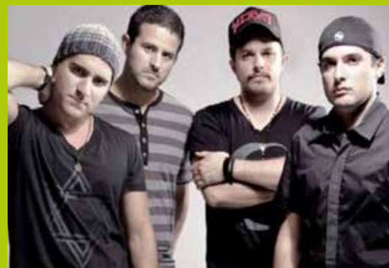
Rockeros quieren difundir su música.

(1987-1993), y "Cosby" (1996-2000) para seguir dando a la comunidad negra la oportunidad de protagonizar historias positivas. El camino que el artista abrió ha sido seguido por decenas de series como "One on One", "Everybody Hates Chris", "My Wife and Kids", "The Proud Family" y las exitosas "Empire" y "Blackish", aunque ninguna de ellas tuvo el mismo impacto.