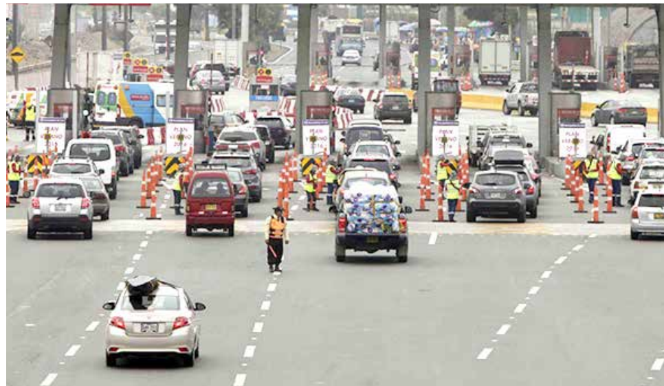
Conductores respondieron al llamado de la Municipalidad de Lima.

Para garantizar el éxito de este llamado, la comuna metropolitana, en coordi-