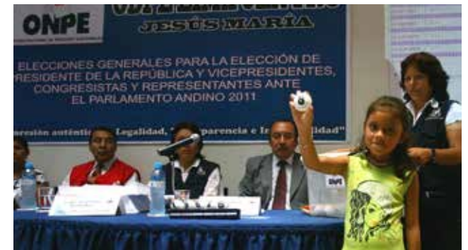
Resultados del sorteo se publicarán en sedes de la ODPE.

Luego del sorteo, los listados de los miembros de mesa son publicados en cada una de las sedes de las ODPE, así como en diversos lugares públicos de los distritos electorales.