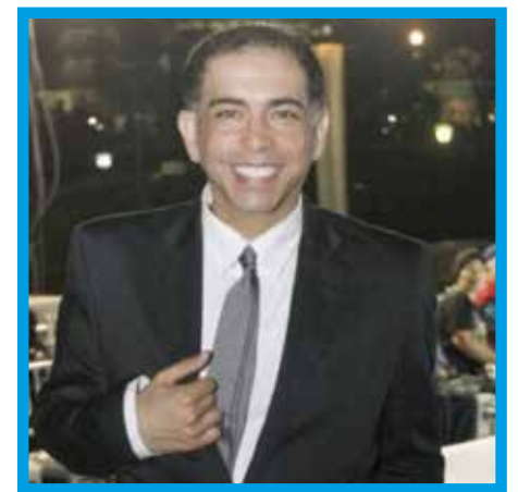
Ernesto Pimentel busca nuevas metas.

Sobre su balance del año 2015, Pimentel señala que "en el nivel laboral hemos liderado todo el año en nuestro horario y estamos considerados entre los 10 programas más visto de la televisión. Nuestra formula siempre ha sido la música y el humor.