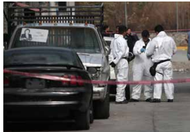
Consternación por asesinato de alcaldesa.

Autoridades calificaron asesinato como un "desafío de la delincuencia". Hay 4 detenidos..