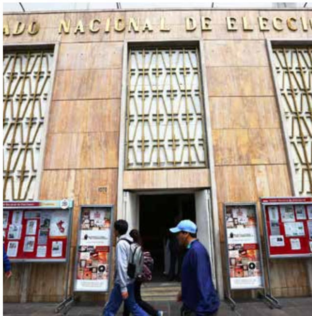
Ciudadanos deben conocer hojas de vida de los candidatos.

Asimismo, la relación de sentencias condenatorias