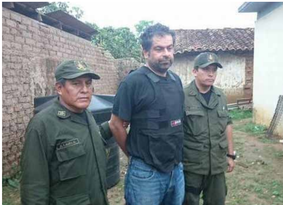
Martín Belaúnde Lossio también está entre casos emblemáticos.

Respecto a las denuncias ingresadas durante el 2015