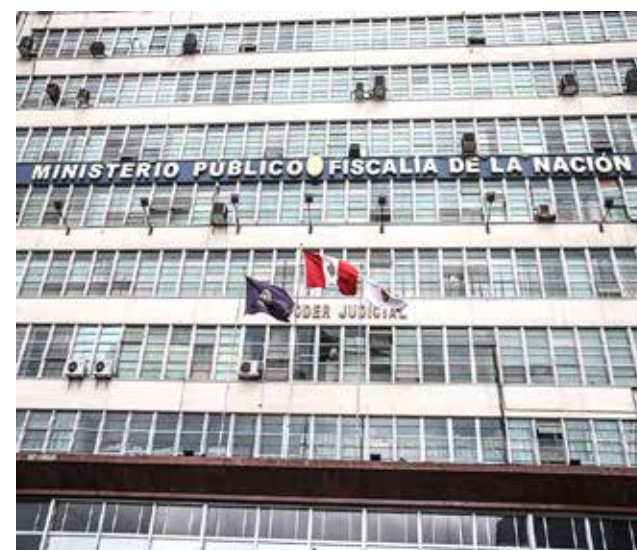
Ministerio Público logró que se haga justicia.