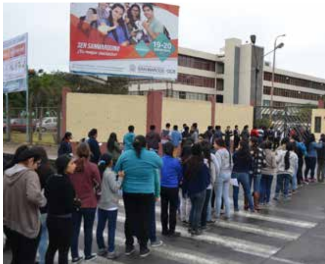
Estudiantes son los más perjudicados con el tema.

También señaló que la Sunedu deberá actuar con firmeza y hacer respetar su