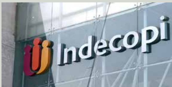
Indecopi sanciona con 50 UIT a Inter Artis Perú.

La resolución 421-2015/CDA-Indecopi, emitida por la Comisión de Derecho de Autor, se sustenta en el incumplimiento de Inter Artis Perú al no presentar documentación que permitiera determinar que las tarifas establecidas por dicha entidad, cumplían con los principios de razonabilidad.