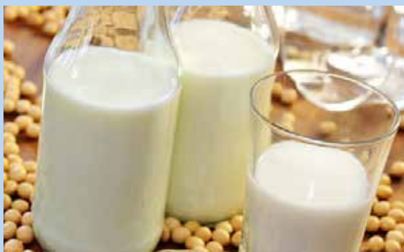
La leche vegetal combate el estreñimiento.

El especialista en medicina natural Alex Filio Rojas atribuyó esta molesta condición a que cada vez más gente prefiere los alimentos refinados y casi no consumen fibra.