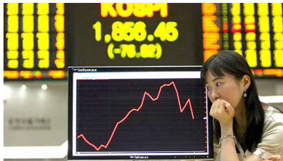
La economía en China sigue sin levantarse.

Shanghái ya perdió cerca del 10 por ciento la semana pasada, en un clima de pánico que recordó el crac bursátil chino del verano boreal de 2015. La onda expansiva de esta