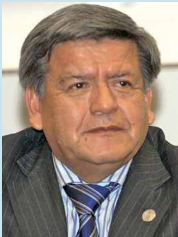
Cesar Acuña tuvo que subsanar faltas en inscripción de candidatura.

Acompañan a Acuña en la plancha presidencial Anel Townsend y Humberto Lay como candidatos a la primera y segunda vicepresidencia.