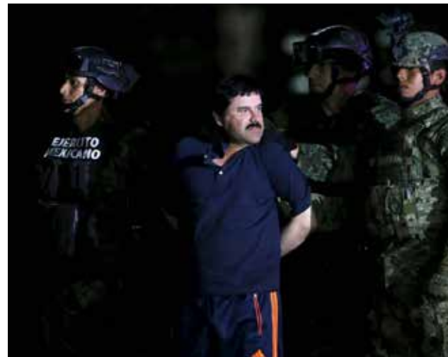
Un año demoraría extradición del "Chapo" Guzmán.