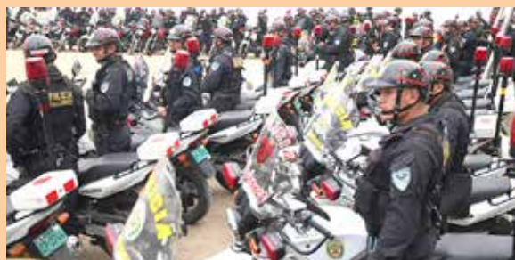
Policía hace advertencia a revoltosos.

Ante ese hecho la PNP decidió mandar un mensaje de advertencia a las personas que señalaron que participarán en ese acto vandálico.