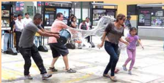
Ate no quiere carnavales este año.

“Los carnavales son tradicionales, pero la ola delincinencial hace que detrás de estos juegos se escuden personas inescrupulosas que usan ese momento