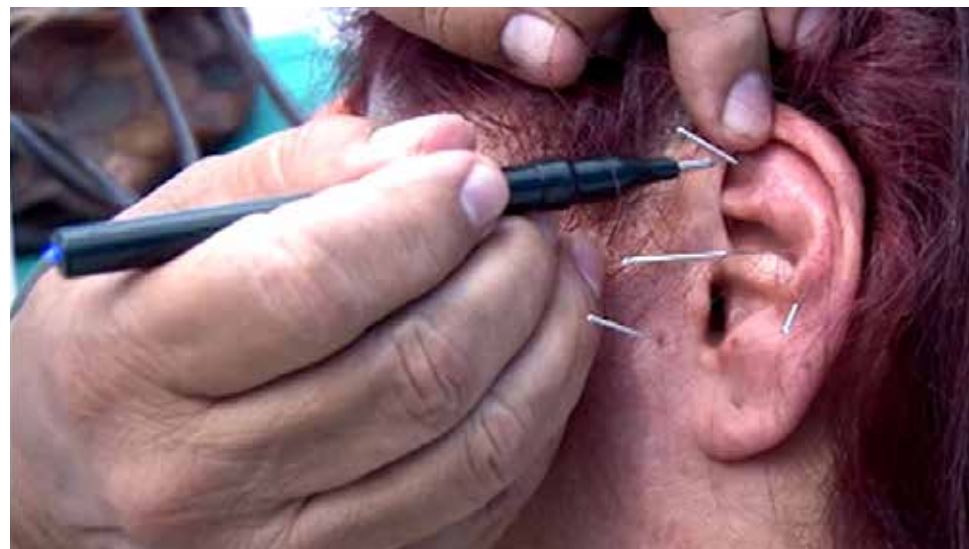
La auriculoterapia es un éxito.

acupuntura clásica, la energía circula por el organismo a través de unos canales o meridianos y cuando esta energía circula el paciente no sufre de enfermedades.