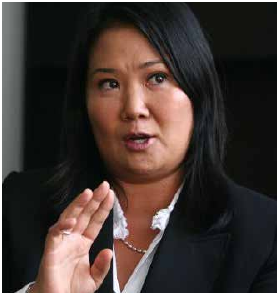
Keiko Fujimori con la espada desenvainada.

"Cuando uno hace el análisis del antivoto o del rechazo, nosotros podemos decir con gran satisfacción que el antivoto de Fuerza Popular es el mejor, es el mínimo", refirió durante una