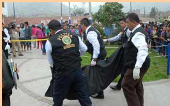
Asesinan a joven de tres disparos.

Mientras algunos señalaron que se trató de un asalto, otros precisaron que se trataría de un ataque con móviles pasionales. La policía investiga las dos hipótesis.