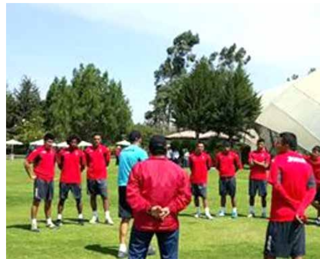
Melgar empezó pretemporada con miras al torneo 2016.