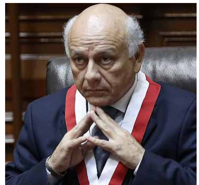
Norman Lewis recurre a la acción de amparo para evitar proceso judicial.