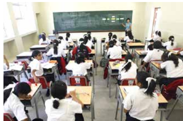
El próximo lunes se cierra inscripción para concurso docente.

Los interesados en concursar deben registrarse primero en la página web del