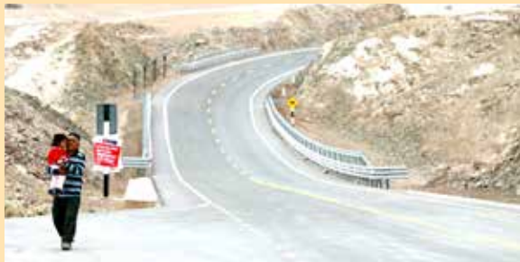
En dos meses estará listo tramo de carretera Mazamari.

"Es parte de la estrategia de hacer que el eje Satipo-Mazamari se convierta en un gran centro comercial y económico".