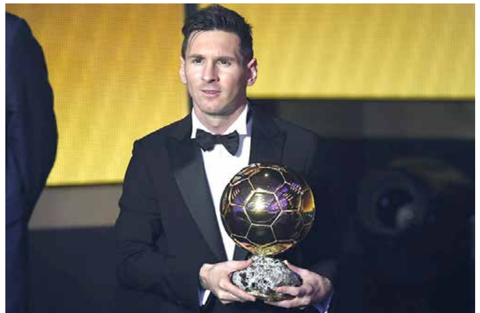
Messi fue el mejor de 2015 para la FIFA.

"Es un momento muy especial para mí volver a estar de nuevo aquí después de ver como en los dos últimos años Cristiano Ronaldo lo ganaba", ha dicho Messi