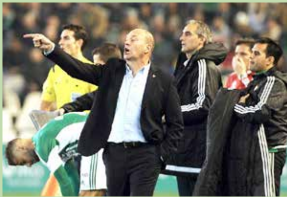
Betis se quedó sin entrenador.