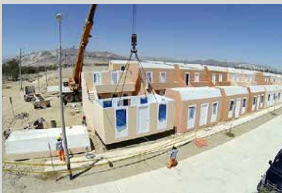
Se impulsará proyectos de inversión privada.

A través de una Resolución Ministerial, señala que estas atribuciones se tomarán conforme a lo dispuesto por el Decreto Legislativo N° 1224 de Promoción de la Inversión Privada mediante Asociaciones Público Privadas (APP) y Proyectos en Activos.