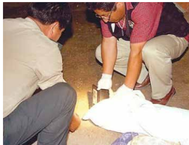
Horrendo hallazgo en Chosica.

"Me llamó la atención un fuerte olor. Al ver de qué