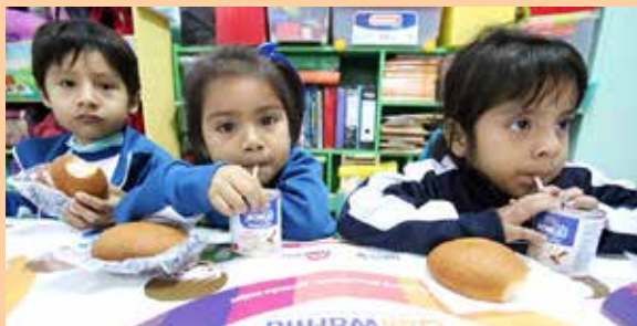
Qali Warma comprará 900 toneladas de quinua.

Moreno, señaló que Qali Warma está haciendo todos los esfuerzos para incrementar la cantidad de este grano con relación al 2015, cuando se compraron 704 toneladas. El propósito es aumentar provisión de quinua entera para un día más de quinua en el menú de los niños que reciben la canasta con productos y no los alimentos preparados.