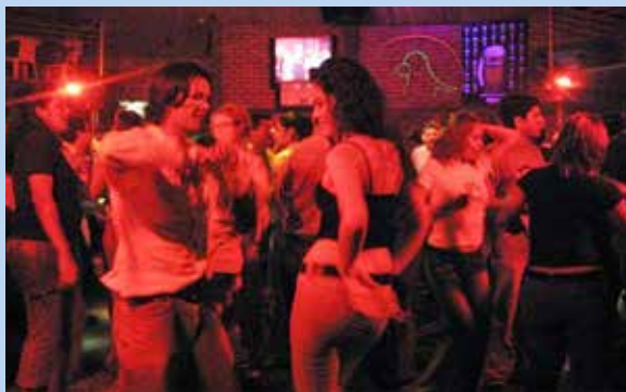
Marihuana y éxtasis son las más consumidas.

El consumo de estas drogas, inicialmente puede generar desinhibición y euforia, sin embargo sus efectos pueden ser mortales y dependerán de las características físicas y psicológicas de cada persona.