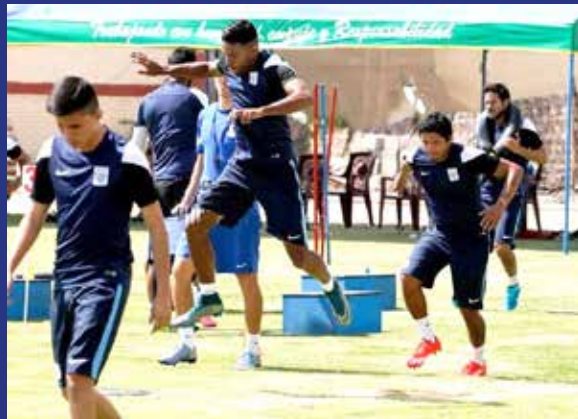
Alianza Lima también inició pretemporada.

El conjunto íntimo volverá a Lima el domingo, para continuar con los entrenamientos a doble turno durante una semana y luego viajarán a Chíncha por tres días, para dar por finalizada la pretemporada.