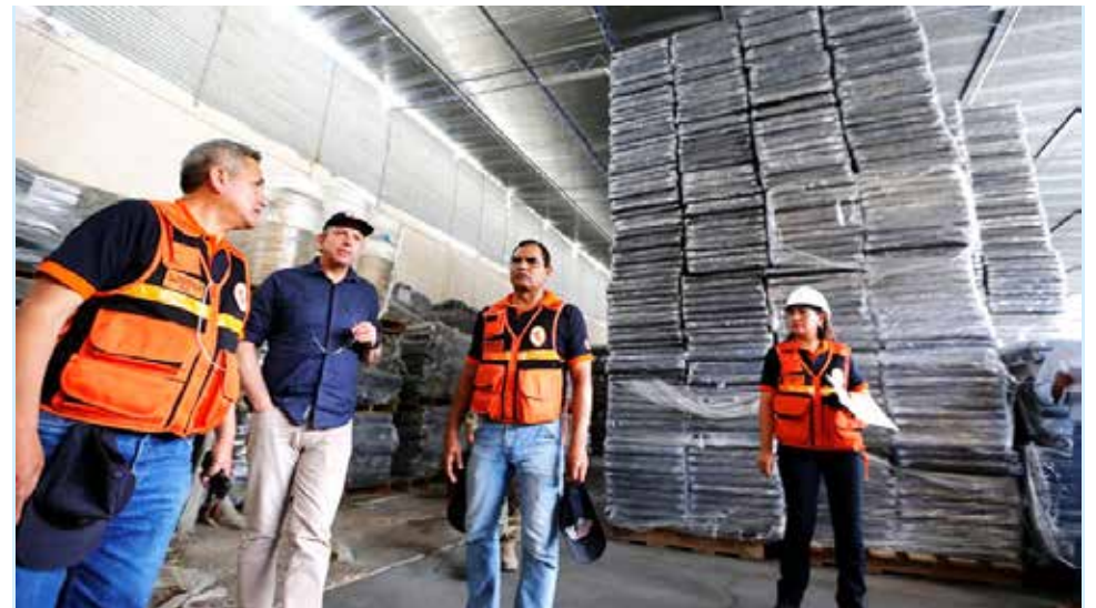
Almacenes del Indeci listos para atender emergencias de FEN.

El funcionario indicó que cada uno de los 19 almacenes del Indeci, a los que se suman cinco facilitados por las Fuerzas Armadas, otros dos por empresas privadas y tres que están por habilitarse, han acopiado herramientas, prendas de vestir y alimentos no perecibles para atender necesidades urgentes