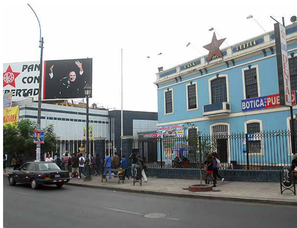
Hieren de balazo a mujer cerca de la casa del Pueblo.

Junto a la herida, caminaba la modelo y ex conductora de televisión Karla Casós quien denunció a través de su cuenta de Twi-