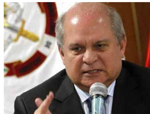
Pedro Cateriano anuncia veedores de la OEA.

Elecciones. "Aún no hemos conversado quien presidirá esta misión electoral, esta es una competencia del secretario general de la OEA, Luis Almagro, y calculo que en las próximas semanas el dará ese anuncio público", añadió.