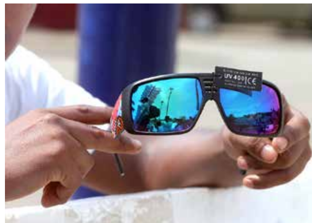
Lentes de sol deben pasar prueba de uveómetro.

Durante una demostración realizada en una playa de Costa Verde, los especialistas del INO señalaron que estos lentes polarizados deben contar con una medida