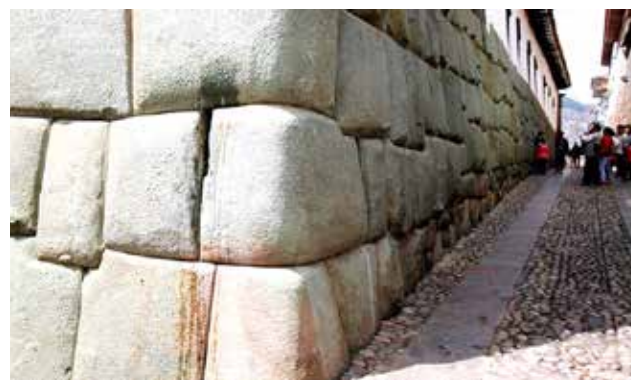
Limpian pinta sobre vestigio inca.