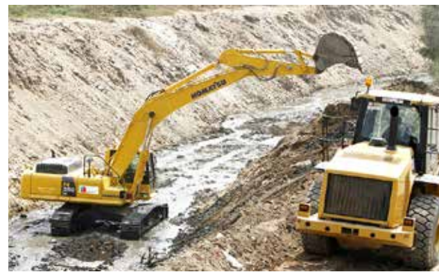
Inversión pública creció 22% en últimos años.

Destacó que entre el 2011-2015, el monto ejecutado de la inversión fue de 144,367 millones de soles,