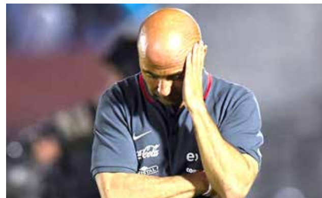
Sampaoli sacó campeón a Chile en la pasada Copa América.

Sampaoli, nominado por la FIFA como el mejor técnico del año, fue ratificado el viernes en su cargo por las nuevas autoridades de la Federación de Fútbol de Chile, asumidas tras la intempestiva renuncia de