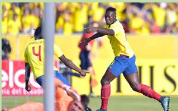
Ecuador jugará contra Estados Unidos.

El estratega señaló que el choque con la escuadra estadounidense será el primero de dos encuentros de foguero, que la tricolor jugará en canchas de Estados Unidos antes del certamen continental.