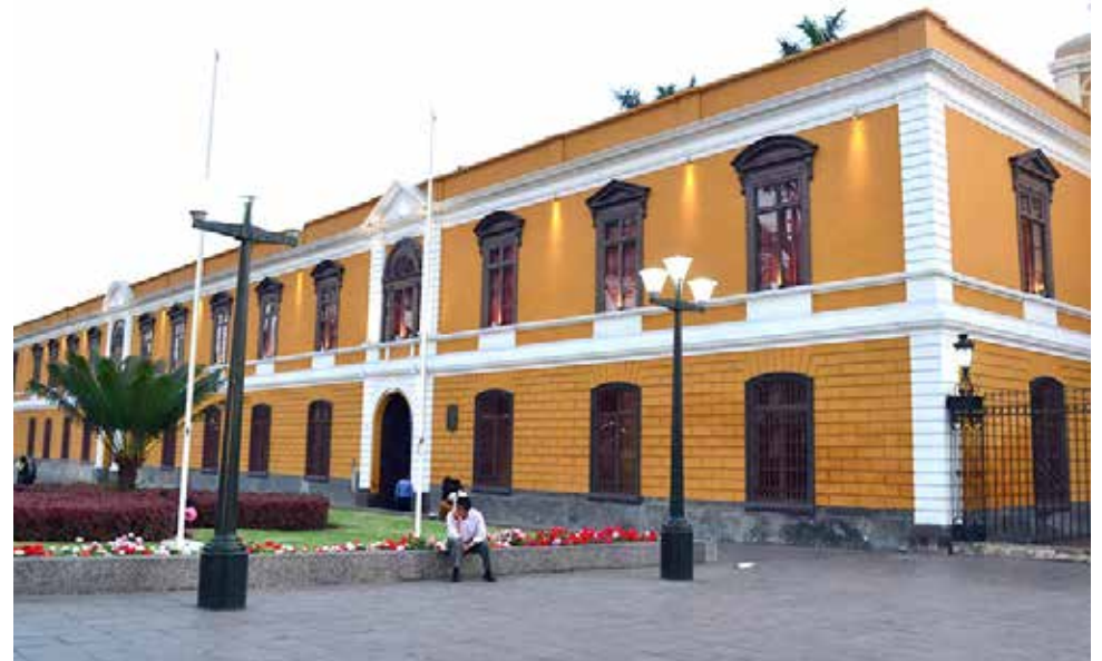
San Marcos garantiza adecuación a Ley Universitaria.

“Para tal fin, en el marco de la autonomía y los