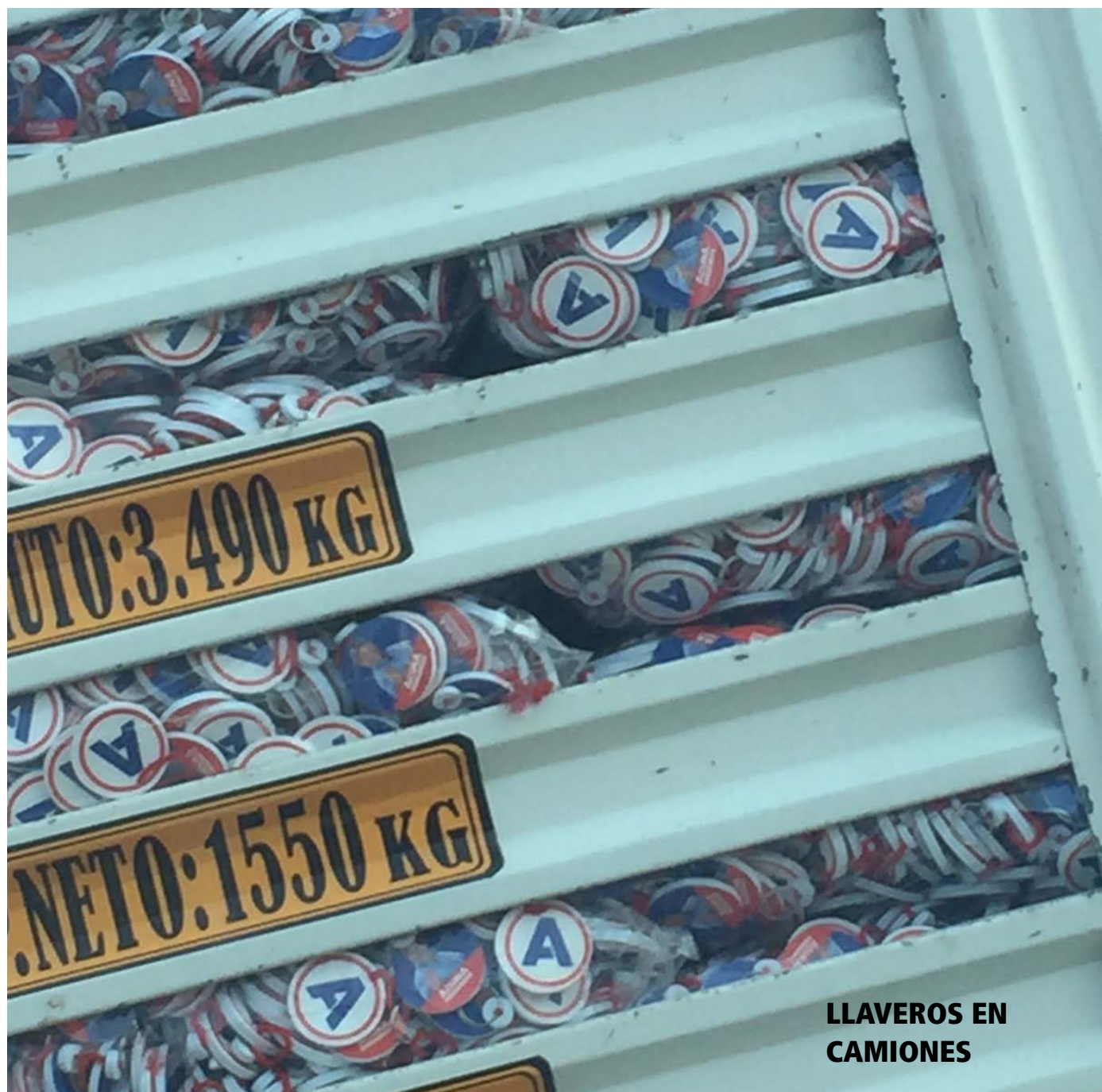
LLAVEROS EN CAMIONES

Fabricación en masa de colgajos propagandísticos se suma a la de los panetones.