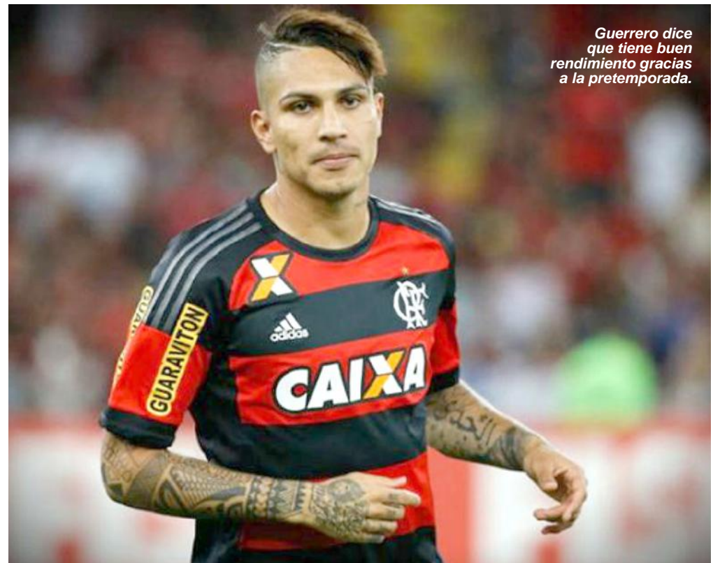
Guerrero dice que tiene buen rendimiento gracias a la pretemporada.

Guerrero también dijo que no escucha las críticas de la prensa o la hinchada, y que está consciente de que estuvo cinco meses sin marcar y su una preocupación es seguir jugando lo mejor posible.