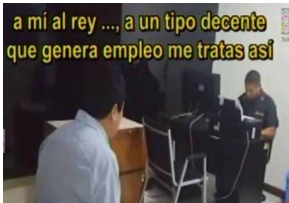
Hombre armó un escándalo y agredió a los policías con insultos.

Un video difundido por "Reporte Semanal" muestra al empresario lanzando todo tipo de agravios contra los policías. Esta es parte de su vengonza defensa: "A mí, al rey..., a un tipo decente que genera empleo me tratas así. ¿Te parece decente eso...? A mí no me puedes tratar así, tú te equivocaste".