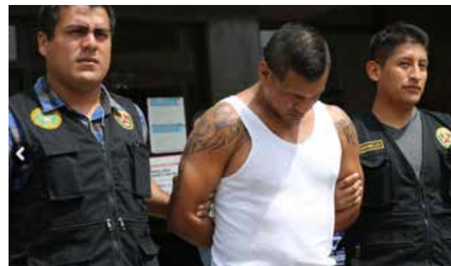
Sujeto será denunciado por falsificación, usurpación, y otros.

tura adujo ser miembro de la Policía Nacional y trabajara en la Divincri de Ca-