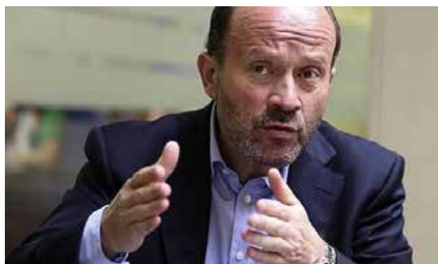
Aerolínea calificó hecho como aislado y que se limitó a contabilización no registrada.

La SEC halló que el ejecutivo de Lan -que en ese entonces se desempeñaba como jefe de operaciones de la aerolínea miembro del grupo Latam- pagó unos US$1,15 millones a un consultor independiente que se ofrecía como intermediario en la disputa laboral, dinero que iría a manos de líderes sindicales