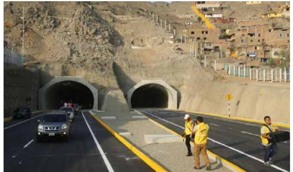
El empleo de estas vías ha significado un ahorro considerable.

El nuevo horario regirá desde las 8 a.m. hasta las 5 p.m. Esto responde a que, desde su inauguración, por los túneles circulan muchos vehículos al día. Anteriormente, la 'marcha blanca' empezaba a las 10 a.m. y terminaba a las 4 p.m. A través de un comunicado, la Municipalidad de Lima expresó que estas nuevas obras gozan de una "cre-