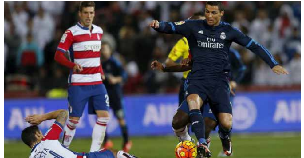
Real Madrid venció al Granada de visita por la Liga BBVA.

Fue el primer triunfo del Real Madrid como visitante con Zinedine Zidane en el banquillo y sirvió para que su equipo se mantuviera a un punto del Atlético y a cuatro del Barcelona, líder