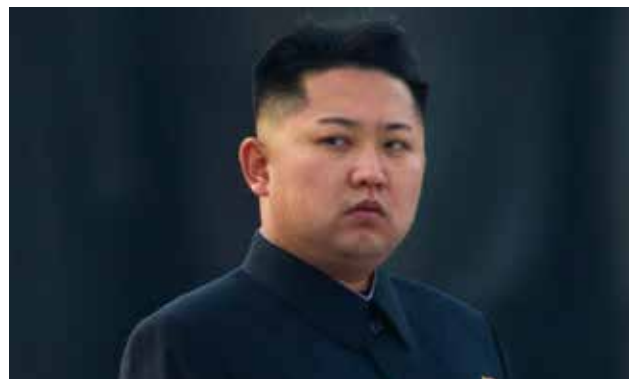
La ONU mantiene un debate para imponer sanciones a Corea del Norte.

El Servicio de Inteligencia de Corea del Sur (NIS) anunció que Corea del Norte prepara una quinta prueba nuclear, un mes después de que el país comunista detonara por cuarta vez un dispositivo atómico en su territorio. A tan solo unas horas de que Corea del Norte lanzara un satélite al espacio, una acción que ha motivado la rotunda condena de la comunidad internacional al considerarse un ensayo de misiles, la inteligencia de Seúl anunció sobre un nuevo plan del