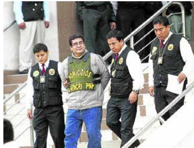
Monseñor Piorno se mostró a favor de ampliación del estado de emergencia.

Gálvez, quien mantuvo en reserva la identidad de los amenazados, sostuvo