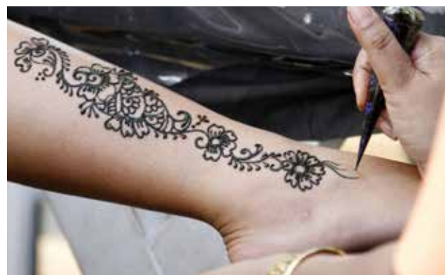
"Henna Negra", peligroso tinte empleado para hacer tatuajes que dañan la piel.

El problema está cuanto se pinta la piel con la "henna negra", un tinte sintético cuyo principal compuesto es la p-fenilendiamina (PPD), un tipo de carbón mineral utilizado principal-