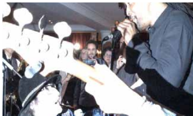
La gira sudamericana de The Rolling Stones seguirá en Argentina (10 y 13 de