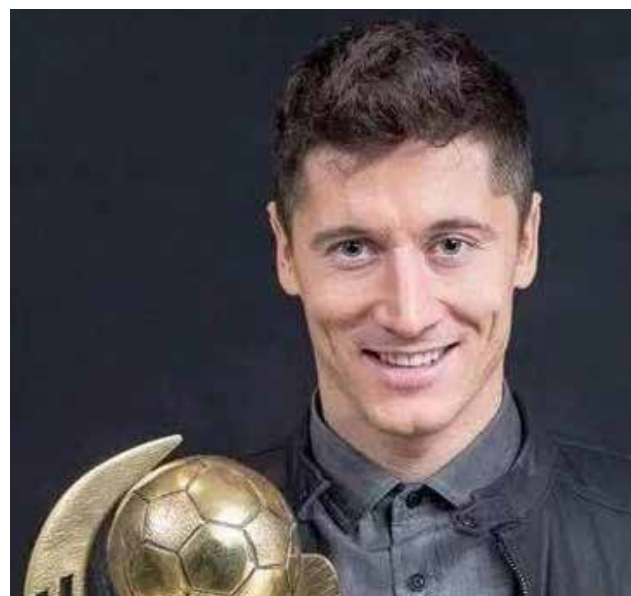
Premio es un galardón al mejor futbolista polaco en cualquier liga del mundo.

Robert Lewandowski, delantero estrella del Bayern Múnich, fue elegido por quinta vez consecutiva mejor futbolista polaco del año, anunció la federación de su país. "El año 2015 fue fantástico, para mí y para todos los fans polacos. Espero que 2016 siga igual y pueda festejar grandes éxitos con el Bayern y con la selección", dijo Lewandowski en la noche, tras conocer que había sido galardonado. A principios de enero, el atacante de 27 años había sido distinguido por primera vez con el premio a mejor deportista del año en Polonia. El jugador del equi-