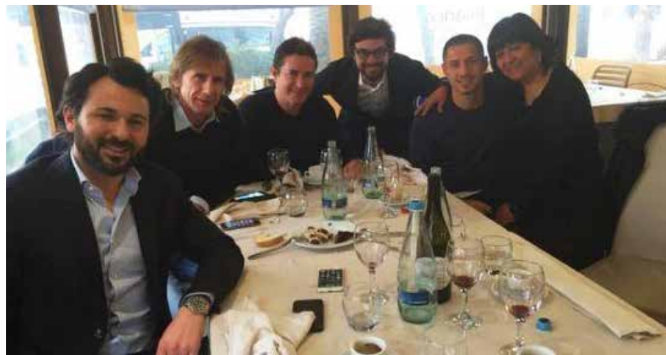
Ricardo Gareca logró obtener una reunión con Gianluca Lapadula.