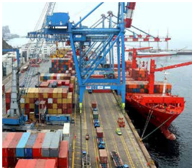
Terminal contará con sistema de reconocimiento óptico en puertas de entrada.

"La modernización del terminal portuario en la zona