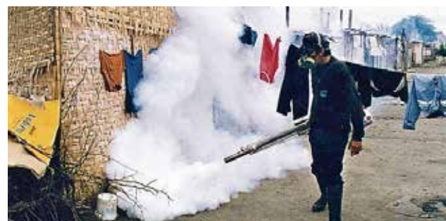
La siguiente reunión se realizaría en la zona de frontera de Madre de Dios.

El jueves último se registró el primer contagio del