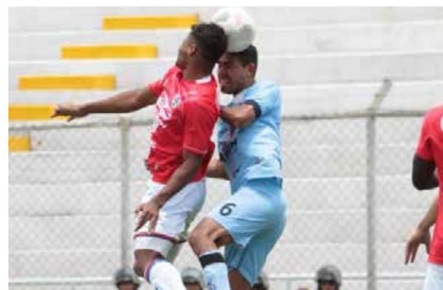
Unión Comercio enfrentará a Alianza Atlético de visitante en el Coloso.

El mediocampista de Unión Comercio, Evany