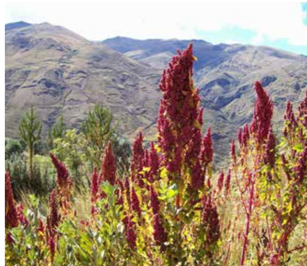
Producción de quinua registró en diciembre una cifra de 1.800 toneladas