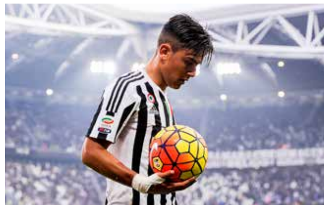
Bayern Munich tendrá mucho dinero si se logra vender a Robert Lewandowski.

Paulo Dybala fue considerado por el mismo Lionel Messi como su sucesor en la Selección de Argentina y eso ha despertado el interés de muchos clubes europeos, eso también sin contarnos su extraordinario nivel que muestra fecha a fecha con Juventus. El argentino será el jugador más codiciado en el próximo mercado de pases y por ahora es Barcelona el club que tiene mayor opción de jalarlo, sin embargo el dinero podría determinar su futuro y más con la opción millonaria que apareció en torno a la 'Joya'.