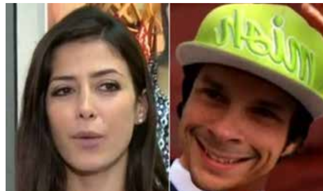
Programa destacó el rostro de sorpresa de Mario Hart.

El hecho fue registrado por las cámaras de "América Espectáculos", programa que destacó el rostro de sorpresa de Mario Hart y sus intentos posteriores por