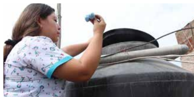
Durante las visitas se han detectado larvas en algunas viviendas de El Progreso.