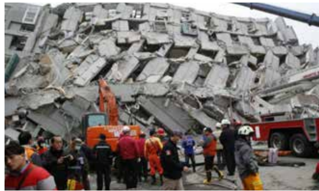
Sismo de magnitud 6,4 grados que sacudió la isla causó al menos 38 muertos.

los escombros más de 60 horas después de la catástrofe, comprobaron periodistas de la AFP, que la vieron tumbada en una camilla. También un hombre de 40 años fue sacado de entre los cascotes con ayuda de una grúa. Los servicios de socorro cuentan que trataron durante 20 horas de