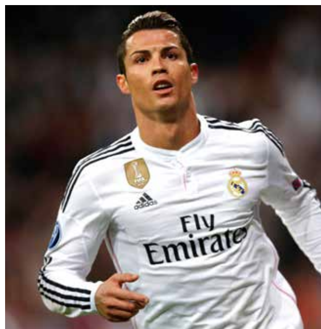
"Me quedan un par de años y después se verá", dijo Ronaldo.

tano se peleó con la barra del Madrid, pero ya ahora que todo ha vuelto a la calma.