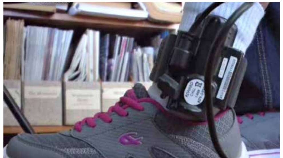
Grilletes son como celular; interno se comunicará con empresa que vigila.