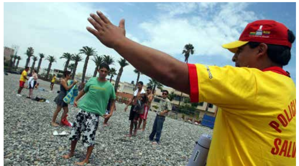
Los bañistas deben reposar luego de alimentarse y cuidar a los menores.

"El año pasado hubo 1,250 emergencias entre los meses de enero y marzo pero ahora, solo en enero de este año, han sido 967. Hay mucha irresponsabilidad