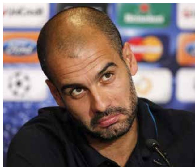
Guardiola, fue anunciado como entrenador en sustitución de Pellegrini.

"Lo conocí hace varios años, cuando yo dirigía al Manchester City. En aquella época él estaba jugando en Oriente Medio y recuerdo