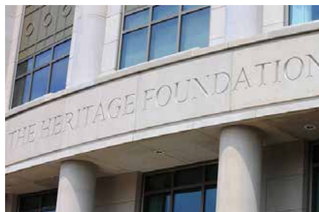
Hay problemas en fuerzas de seguridad, los organismos de aduanas, y otros.

El puntaje del Perú pasó de 67,7 a puntos 67,4 puntos