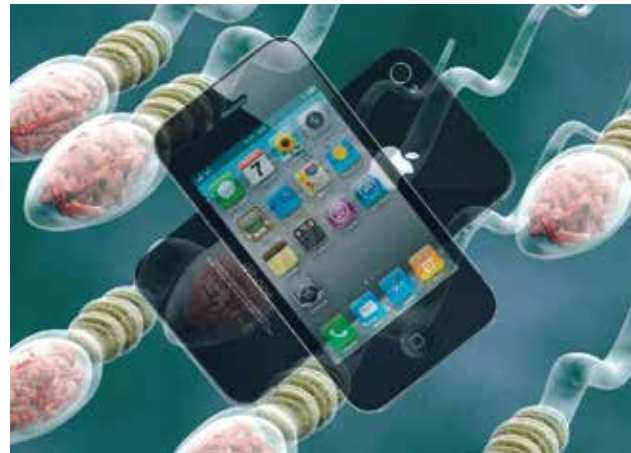
Se apunta que aspectos del celular provocarían efectos adversos en el esperma.

El uso de teléfonos móviles durante más de una hora al día duplica el riesgo de que la calidad del esperma se reduzca a niveles ínfimos para la procreación, según revelan los datos de un estudio realizado por expertos israelíes. La investigación, elaborada por un equipo del Centro Médico Carmel y el Technion de Haifa (norte del país), y publicada esta semana por la revista científica digital Reproductive BioMedicine Online, pone el acento en la temida conexión que se pensaba existe entre la infertilidad masculina y la prevalencia del uso de teléfonos celulares.