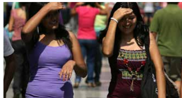
Vientos, entre otros elementos, incrementarán bochorno y sensación de calor.