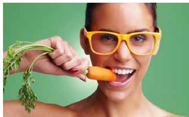
Antocianidinas, nutren los ojos, y ayudan a reparar las células de la retina.

Una buena alimentación es fundamental para proteger tus ojos de enfermedades. El 70% de patologías en la vista se deben a mala nutrición, de acuerdo a la especialista Verónica Talavera. Algunos productos que nunca deben faltar en tus comidas, son por ejemplo las vitaminas, para funcionar correctamente, los ojos necesitan vitaminas A, B, C y E. Se encuentran en alimentos como zanahoria, espinaca, tomate, cereales, frutos secos, limón, naranja, espárragos, lechuga, apio, papa, hígado, entre otras fuentes. En general, la recomendación es ingerir una