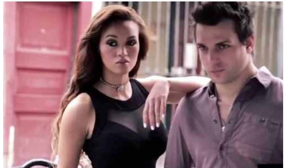
En video, se observa a la pareja muy cariñosa como si hubieran retomado su relación.

En el video, se observa a los integrantes del reality Esto es guerra en tratos muy cariñosos como si hu-