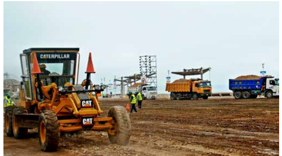
Este año la visita se va a duplicar, por lo menos a 50 mil personas.