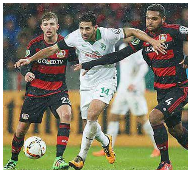
Con la victoria de visita, el Bremen avanzó a las semifinales de la Copa Alemana.