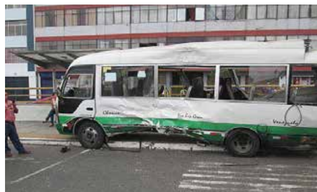
El chofer tampoco tenía la credencial de conductor.

Una de las empresas conocida como 'Chosicano', cuya coaster provocó un accidente de tránsito que dejó un saldo de un muerto y más de 15 heridos, será suspendida por la Municipalidad de Lima. La comuna metropolitana informó que la empresa de transporte Sarita Colonia y Villa Sol S.A. (Etrescovissa) será sancionada de acuerdo a la ordenanza 1878 por la Gerencia de Transporte Urbano. El proceso sancionador incluye la suspensión preventiva de esta empresa co-