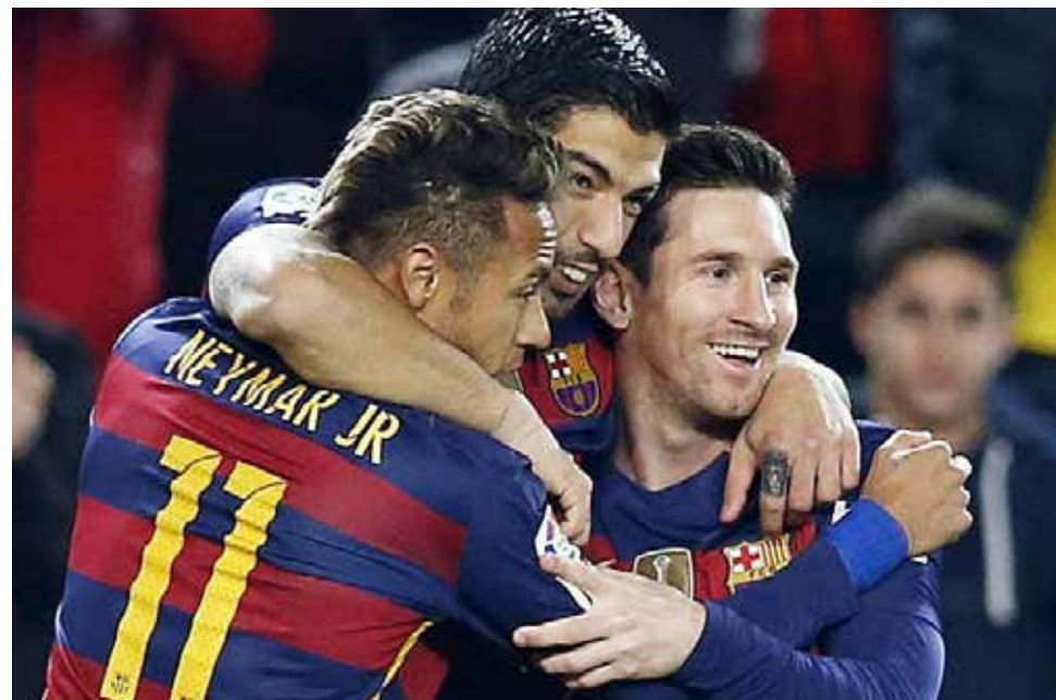
Lionel Messi sufrió un cólico en los riñones que le impidió estar en la semifinal del Mundial.

Como se recuerda Lionel Messi estará fuera de las canchas por un breve corto de tiempo, según informó el Barcelona FC (cuya camiseta viste el astro argentino). "Fue sometido a diferentes estudios para evaluar la evolución de los problemas