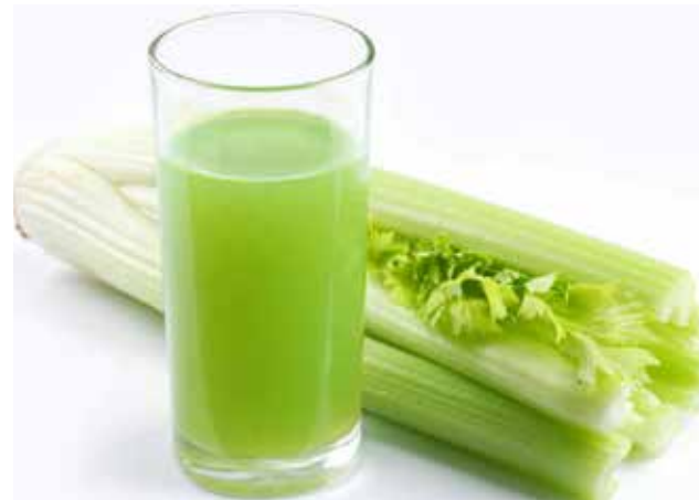
Fomentar la salud y equilibrio interno de nuestro colon es tomando jugo natural.

Por ello, debemos ir con cuidado con esos remedios que buscan solo "limpiar