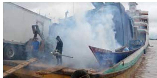
280 abatizadores y más de 40 fumigadores están dando vuelta a la ciudad.

realiza una vigilancia en lugares de tránsito de visitantes como el aeropuerto y terminales terrestres, desde donde llegan personas procedentes de Brasil. Preciso que personal de salud ha sido capaci-