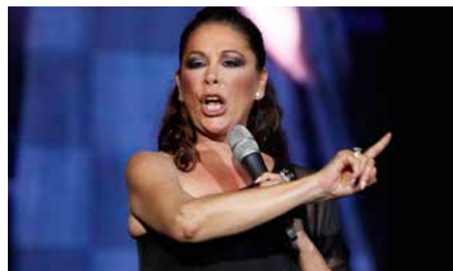
La cantante española fue condenada a pagar 1.14 millones de euros.

Pantoja deberá firmar cada mes o cada dos meses en alguna dependencia de los ser-