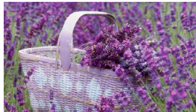
Si deseas hacer un jabón artesanal no dudes en el uso de flores frescas.

En la actualidad su uso se ha extendido por muchos lugares del mundo y hay quienes la aprovechan como remedio natural, en la cosmética y en varias tareas del