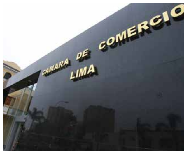
El CCEX destacó que el año pasado creció la importación con 6%.

Los bienes intermedios -sector que representa el 42% de productos importa-