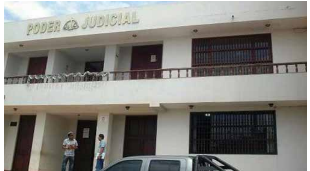
Este caso es el primero resuelto mediante la figura de proceso inmediato.