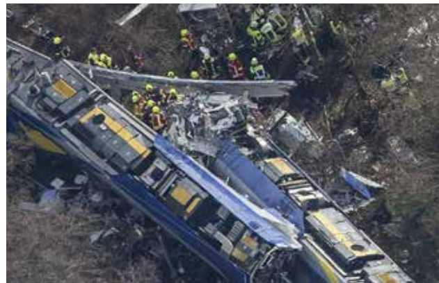
La policía abrió teléfonos de emergencia para atender a los familiares de las víctimas.

La canciller de Alemania, Ángela Merkel, se mostró conmovida por el grave accidente y trasladó sus condolencias a las familias de las personas que han perdido la vida. "También están en mis pensamientos los numerosos heridos del accidente. Les deseo una rápida y en lo posible, completa recuperación", afirmó a través de un comunicado. El ministro de Transporte de Alemania, Alexander Dobrindt, y el titular de Interior bávaro, Jochim Herrmann, acudió al lugar para informarse de pri-