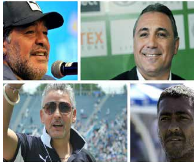
Se jugará en el estadio nacional Vasil Levski de Bulgaria.

"Es mi mayor sueño, reunir en un lugar a los futbolistas más famosos con los que he jugado en mi vida y jugar de nuevo con ellos y contra