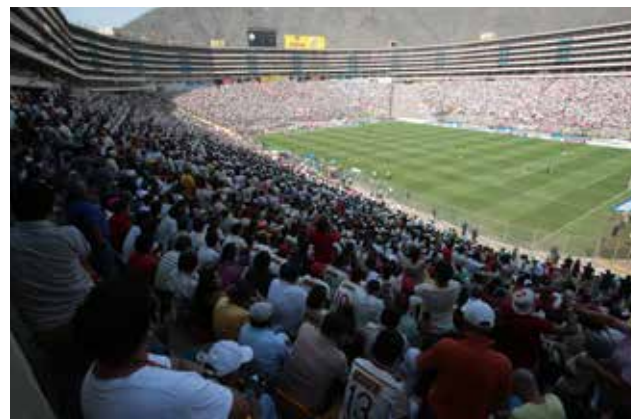
Régimen Especial Reestructuración se creó para proteger a clubes de liquidación.

Indecopi, a través de la Comisión de Procedimientos Concursales de Lima Sur, emitió una resolución que declara el inicio del Proceso Concursal Ordinario del Club Universitario de Deportes. Con ello, se abre la posibilidad de una liquidación de la "U" si esta fuera aprobada por la Junta de Acreedores. Ya hace unos meses se alertó respecto a que el Club Universitario era el único que corría el riesgo de ser liquidado ya que de los cinco clubes de fútbol sometidos a proceso concursal en el Indecopi por insolvencia, es el único que no tiene un plan de reestruc-