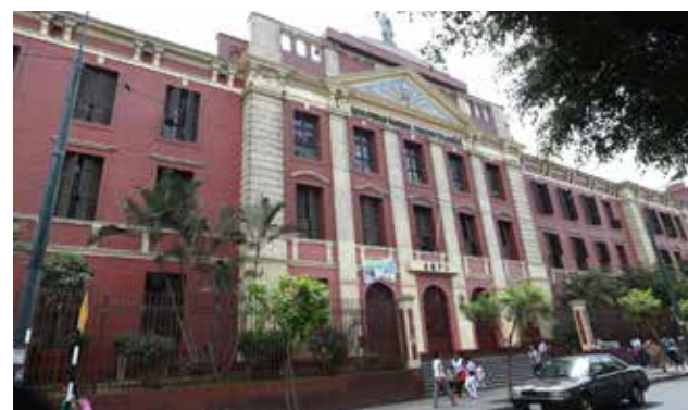
También se exhorta a la comunidad universitaria a garantizar elecciones

La inscripción de las firmas se realizó después de que la Asamblea Universitaria Transitoria de la UNFV decidiera designar autoridades interinas en cumplimien-