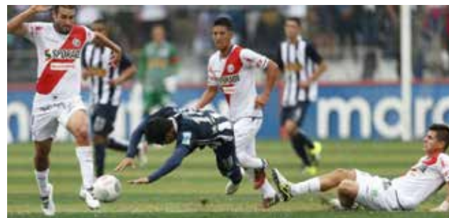
Último partido, Deportivo Municipal venció por 2-1 a Alianza Lima.