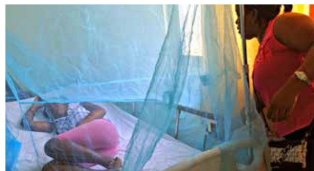
Hasta el momento no se ha reportado ningún caso de zika en La Libertad.

El primer caso de chikungunya en La Libertad fue reportado a inicios de año, luego de que una trabajadora sexual de nacionalidad ecua-