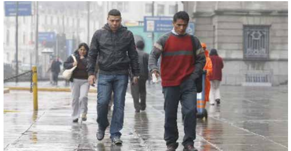
Todos los peruanos deben tomar sus precauciones sobre esta lluvia.

De acuerdo con los equipos de medición del Senamhi, la lluvia registrada ayer tuvo una intensidad de 2 milímetros (2 litros por me-