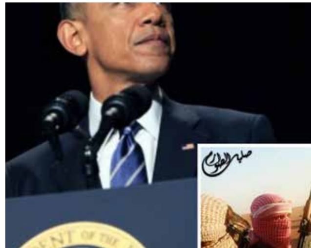
Apoyo de EE.UU. al PYD y YPG, suscitó tensiones entre Washington y Ankara.

"¡Eh, Estados Unidos! No pueden obligarnos a reco-