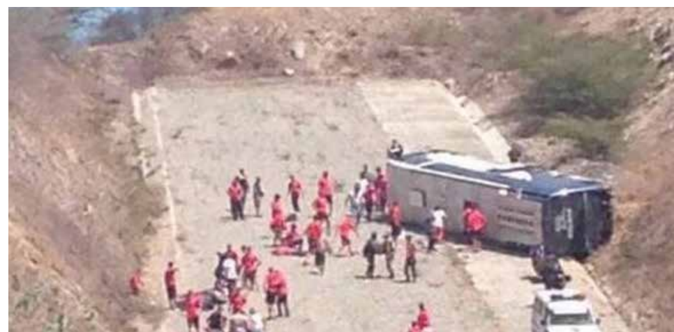
Embajador de Argentina acudió al hotel para ver la salud de los jugadores.

Tartarones explicó que el bus "perdió los frenos" y se deslizó por una rampa de emergencia de la autopista Caracas-La Guaira, que comunica a la capital venezolana con la terminal