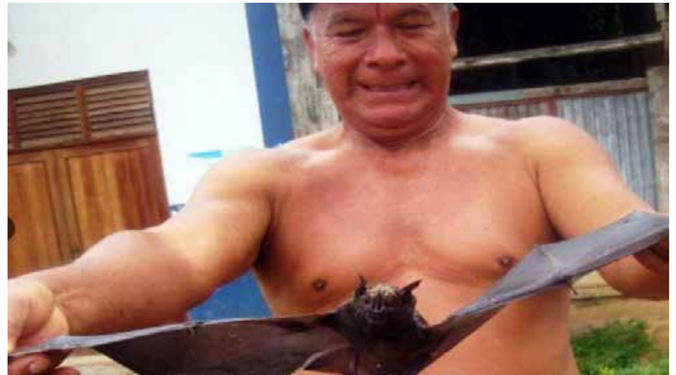
El gobernador de Loreto pidió declarar en emergencia la salud en su región.

Las dos últimas víctimas mortales contrajeron la enfermedad en la comunidad de Yancuntich, ubicado en el distrito de Morona, cerca de la frontera con Ecuador. Ambos menores fueron trasladados hace tres días al Hospital Regional de Loreto, pero su cuadro se complicó y fallecieron. El director regional de Salud