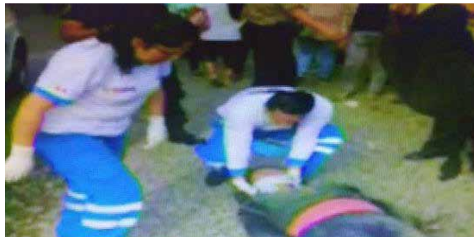
El 'Chosicano' quedó en manos de la PNP.

Una vez más, una coaster conocida como 'Chosicano' protagonizó un accidente, en la Carretera Central. El exceso de velocidad hizo que el vehículo chocara contra una combi, dejando como saldo siete heridos, una de ellas con lesiones de gravedad. Según informaron agentes de la comisaría de Santa Clara a El Comercio, el choque ocurrió a las 7:30 a.m. a la altura de paradero de San Juan de Pariachi, en el kilómetro 12 de la Carretera Central de Ate. El 'Chosicano' de placa W3M-771 embistió a una combi, justo cuando una 'jaladora' estaba llamando pasajeros en el lugar. El vehículo de la empresa de transporte Nueva Era que habría ocasionado