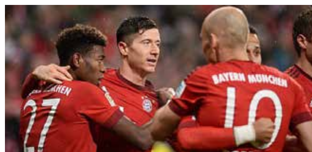
Final de la Copa del Rey se disputará el próximo 21 de mayo.

Bayern Múnich se clasificó por séptima vez consecutiva para las semifinales de la Copa Alemana de fútbol con un triunfo de 3-0 sobre el Bochum, de segunda división. Con goles de Robert Lewandowski (39' y 90') y Thiago Alcántara (61'), el equipo de Josep Guardiola cumplió con su rol de favorito y dio otro paso en busca de su décimo octava Copa ante un rival muy empeñado que tuvo que jugar sin un hombre la mitad del encuentro.