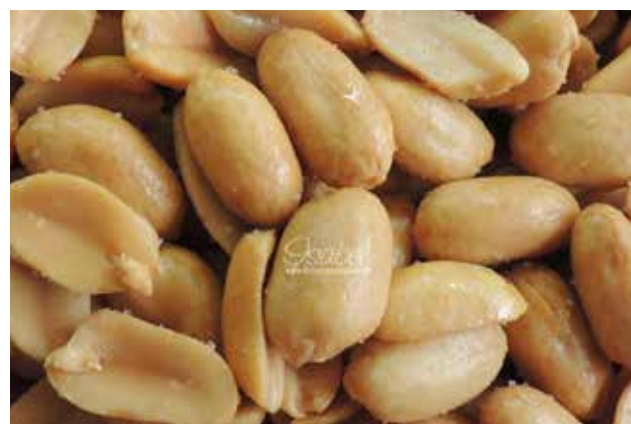
Si nos dejamos llevar por el impulso, comeríamos hasta una bolsa de maníes.