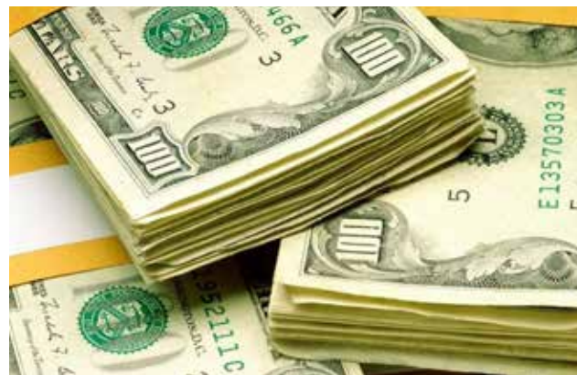
Moneda cotizó en S/ 3.5070, un 0.19% por encima de S/ 3.5050.