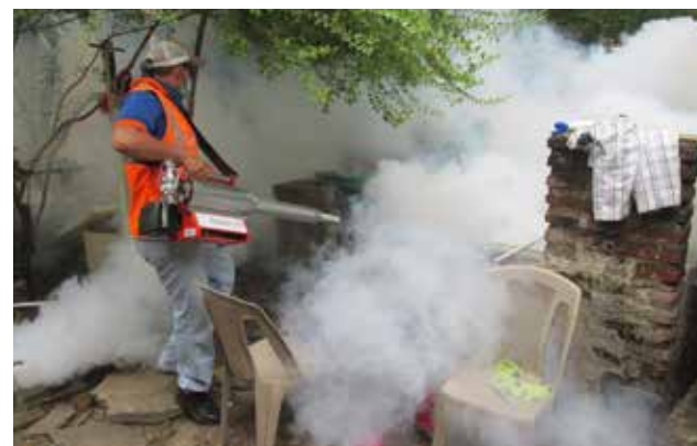
Se debe prevenir y eliminar los criaderos del zancudo.

Sostuvo que esta campaña de fumigación se intensifi-