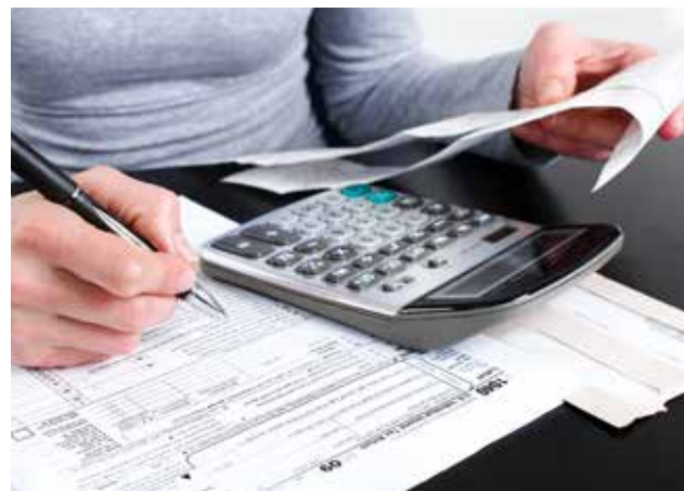
La actual tasa de 18% del IGV es una de las más elevadas de la región.

En un escenario electoral, Oxfam en Perú hace un llamado a los candidatos/as presidenciales y a quienes se encargan del desarrollo e