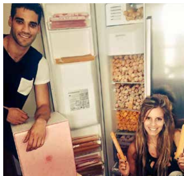
Guty dijo que el mismo entregará los pedidos por delivery.

El modelo e integrante de Esto es guerra, Guty Carrera, anunció que se dedicará a la venta de marcianos aprovechando los calurosos días de verano. "Por supuesto, toda la gente viene a acá (en los exteriores de Esto es guerra) y ve un marciano y dice: 'Marciano Guty', entonces, ahora sí voy a sacar mi negocio de 'Marcianos Guty', ya les informaré", indicó. "Tienen que estar atentos en las redes sociales para que vean los puntos de venta y dónde se van a distribuir (...) Háganme pedidos que yo personalmente les voy a entregar el delivery", dijo Guty Carrera.