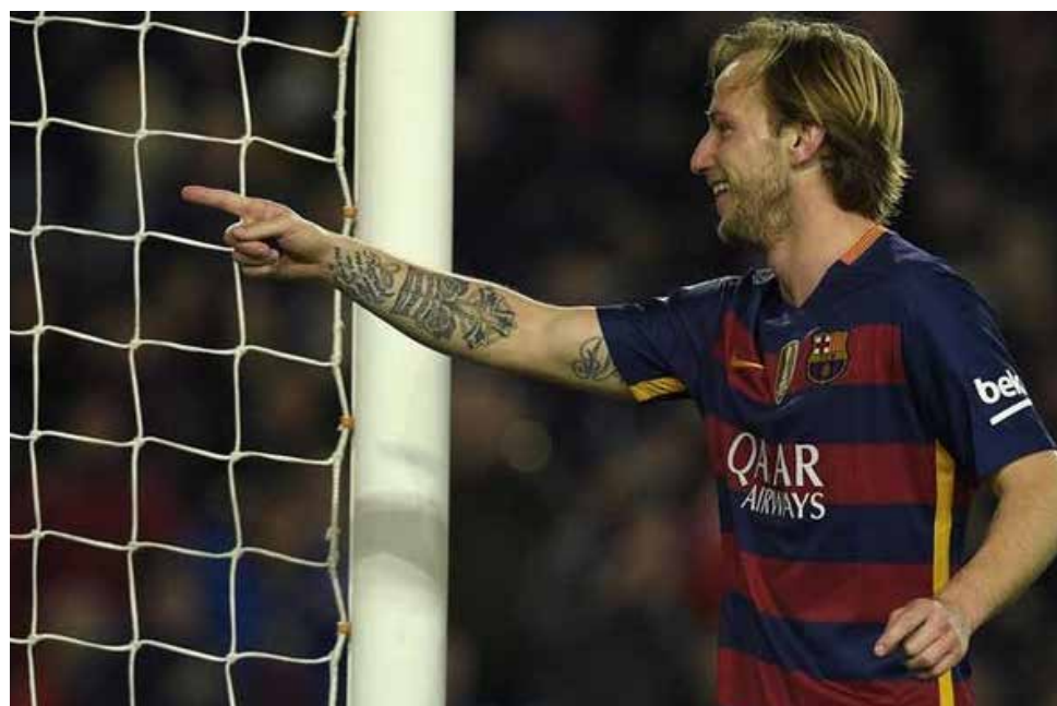
Final de la Copa del Rey se disputará el próximo 21 de mayo.