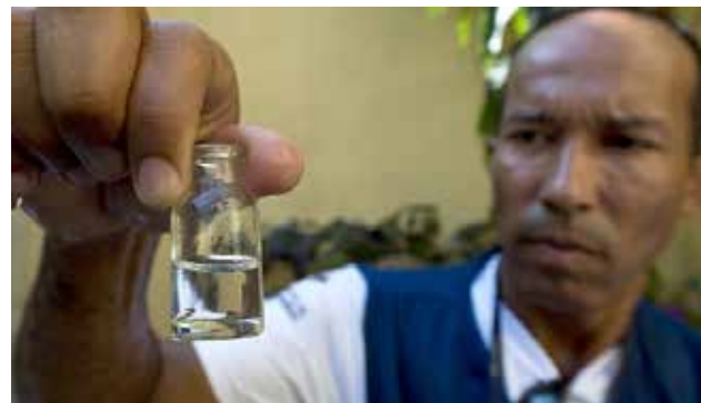
Con el virus se está descubriendo nuevos mecanismos de transmisión.

"El hecho de que haya un virus activo con capacidad de