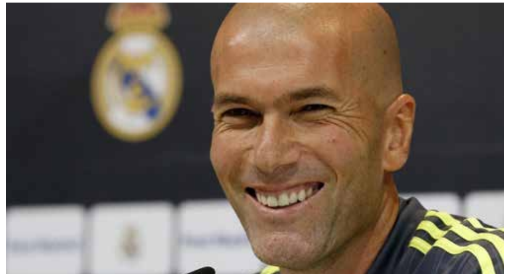
Zidane considera, asimismo, que el ego "es necesario" para triunfar.

El técnico del Real Madrid señala que sobre Cristiano Ronaldo se pueden decir muchas cosas por la imagen,