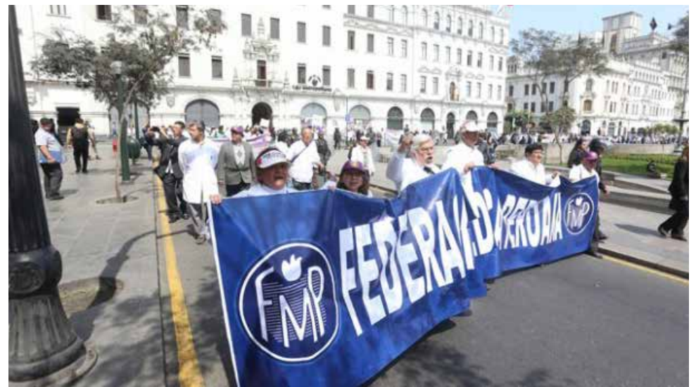
No se descarta una posible huelga indefinida.

"Firmamos un acta el 9 de octubre y nos dijeron que debían aumentarnos S/ 300 a partir de diciembre y en enero aplicar la Escala Salarial. Estamos febrero y no hay ningún incremento pese