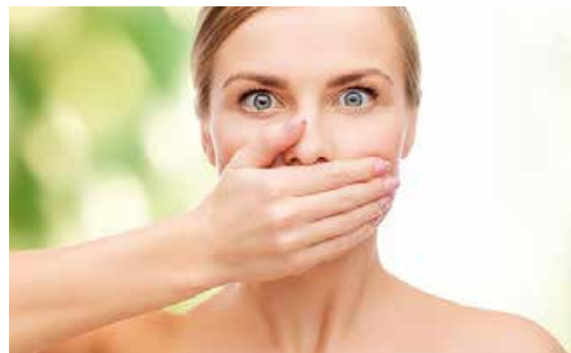
Evita alimentos que favorecen la halitosis, como el ajo y la cebolla.

El 90% de las causas de mal aliento se origina en la boca. Por lo general, el origen de la halitosis se encuentra en los millones de bacterias que viven en la cavidad bucal, ca-