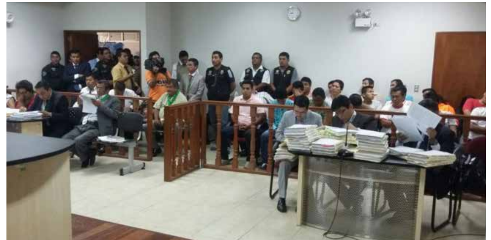
Banda causó zozobra por cuatro años en las ciudades de Trujillo y Chiclayo.