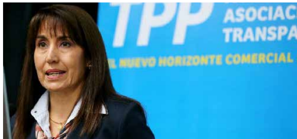
TPP recién sería visto por el Congreso en el 2017.

La implementación del TPP solo requerirá de un cambio legislativo, al dar cinco años de protección de datos de prueba a los medicamentos biológicos, indicó la ministra de Comercio Exterior y Turismo, Magali Silva. No habrá cambios legislativos en el campo laboral. El Ejecutivo se encuentra en proceso de envío del TPP al Congreso para su ratificación, informó la Ministra de Comercio Exterior y Turismo, Magali Silva. No obstante, la ministra evitó precisar la fecha de envío. "No puedo dar una fecha concreta, el Ejec-