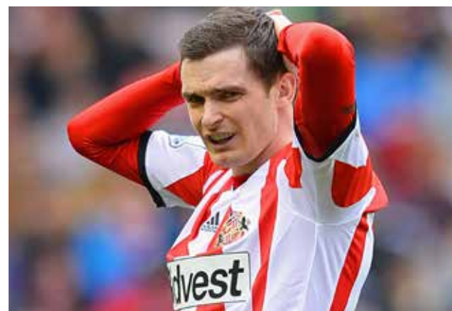
Adidas también anunció que rompía su relación con Adam Johnson.

Horas antes, el entrenador del Sunderland, Sam Allardyce, admitió que Adam Johnson, con un salario de 86.804 dóla-