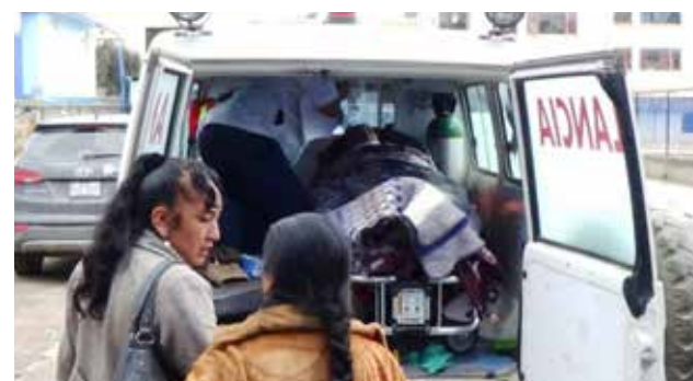
El cansancio del conductor habría sido una de las causas del accidente.

Un total de 15 heridos producto del accidente ocurrido en la carretera Abancay-Andahuaylas en Apurímac, reciben atención de emergencia en el Hospital Regional de Abancay, de los cuales tres son considerados en estado de gravedad. Precisamente el bus de la empresa Los Chankas cayó a un abismo en el poblado de Arcahua, distrito de Huancarama. En el accidente fallecieron dos pasajeros. Al parecer fallas mecánicas habría producido el despis-