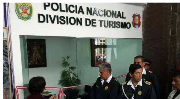
Implementos estarán en el aeropuerto internacional Alejandro Velasco Astete.

La implementación de esta oficina se da en el marco de la activación de