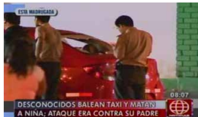
Marina de Guerra debe apoyar a la policía en el patrullaje.

En este sector de Bellavista, Callao, se detuvo el taxi