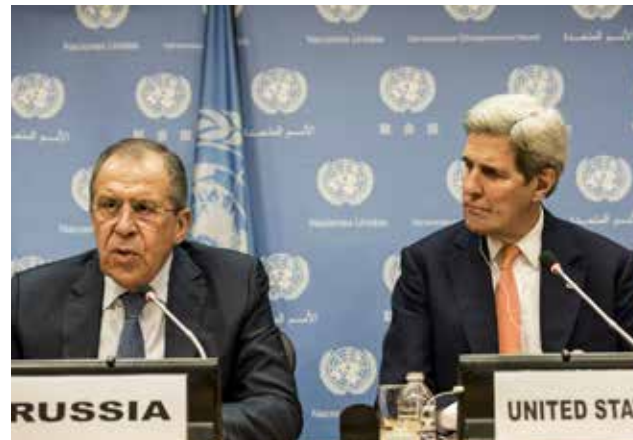
Tensiones son evidentes entre Estados Unidos y algunos de sus aliados.

Rusia anunció que está dispuesta a hablar de un alto el fuego en Siria en una reunión en Múnich para intentar reactivar las negociaciones de paz y frenar la ola de refugiados sirios hacia Turquía. "Estamos preparados para hablar de las modalidades de un alto el fuego", dijo el viceministro ruso de Exteriores, Guenadi Gatilov, pocas horas antes de la reunión en la ciudad alemana de los principales actores de la crisis. "Vamos (a la conferencia internacional sobre Siria) para hablar de