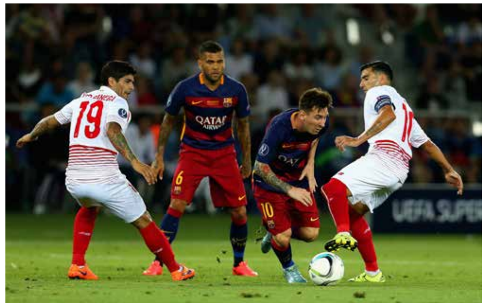
Barcelona se enfrentará al Sevilla en la final de la Copa del Rey.

Tras perder 4-0 en el choque de ida, Celta de Vigo se ilusionó con la remontada mediante los goles de su atacante Iago Aspas (35 y 55 minutos), poniendo a vibrar a su afición en una noche de lluvia en el estadio Balaídos.