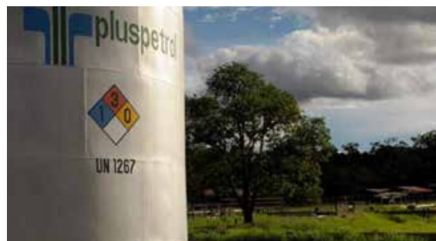
Balón de gas se redujo solo 5.8% en el 2015, señaló Opecu.

"Es inconcebible que el mayor productor de GLP en el país, Pluspetrol, que abastece más del 80% del mercado nacional, reduzca su precio hasta casi 50% en el año 2015 y el balón doméstico baje solo 5.8%, lo cual