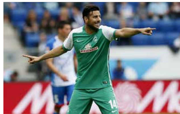
Equipo del peruano necesita ganar para salir del incómodo puesto 16.

El equipo necesita ganar para salir del incómodo puesto 16 que actualmente ocupa en la Bundesliga alemana. Si hoy terminara el