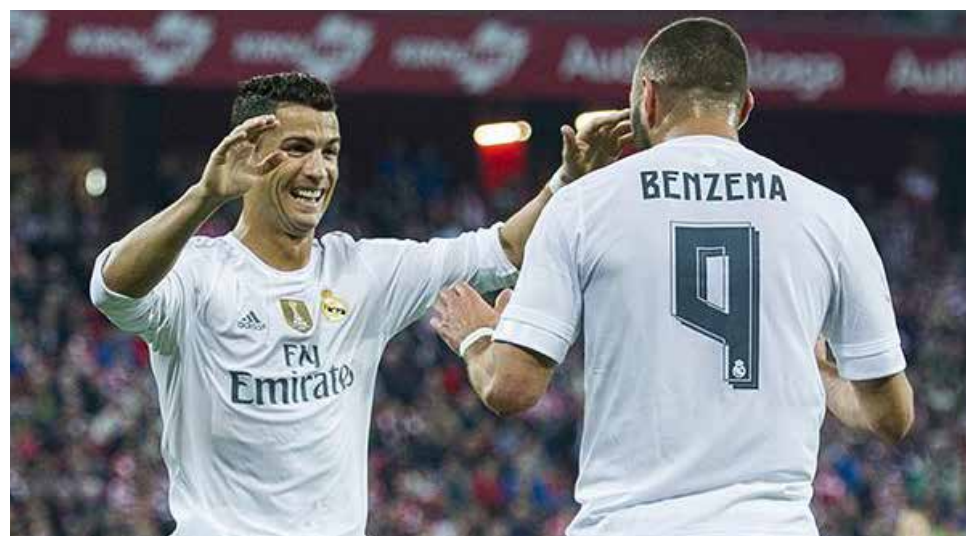
Real Madrid vs. Athletic Club de Bilbao: chocan por la Liga BBVA.

Pese a que desde que Zizou sustituyó a Rafa Benítez como técnico del Real Madrid, el equipo blanco solo ha tenido un partido por se-