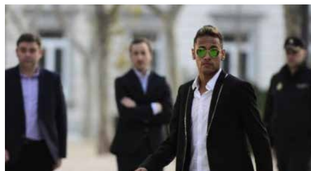
No habría declarado bien su transferencia del Santos al Barcelona.

Un tribunal brasileño rechazó una apelación presentada por Neymar y ordenó que se mantenga el embargo de los bienes del futbolista, medido que pretende asegurar el pago de deudas tributarias y posibles multas derivadas de su fichaje por el Barcelona. La decisión, tomada por un magistrado del Tribunal Federal de Santos, elevó el bloqueo a 192,7 millones de reales (unos US$48 millones), lo que incluye tanto el patrimonio de Neymar como el de su padre y de las tres empresas de la fa-