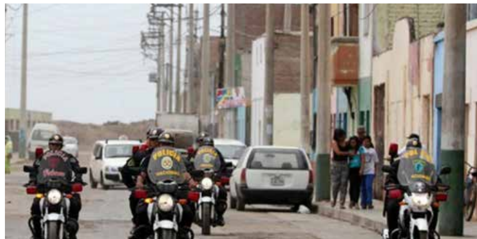
El último miércoles, una menor de 11 años fue baleada por delincuentes.

Sin embargo, el número de homicidios sigue en