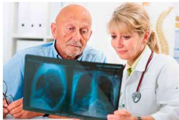
Los medicamentos usados en este estudio ya están aprobados.

Las pruebas se hicieron en modelos animales de ratón y muestras de tumores