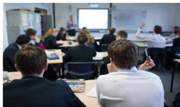
La beca cubre todos los gastos: estudios, hospedaje, alimentación y traslado.

Tras un riguroso proceso de selección que duró casi dos meses y en el que participaron cientos de docentes de diferentes regiones del país, el Ministerio de Educación (Minedu) y el Programa Nacional de Becas (Pronabec) entregará 180 nuevas becas de especialización del idioma inglés, en el marco de la estrategia educativa denominada "Inglés, puertas al mundo". "Beca de Especialización en Pedagogía para Docentes Titulados en la especialidad de inglés y nombrados en Instituciones Públicas de Educación Básica Regular en el nivel secundaria", será en-