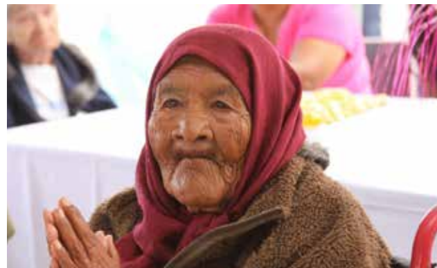
Estudio alerta que la anemia aumenta la mortalidad de adultos mayores.

Además, señala que la anemia es un problema de salud muy frecuente en esta