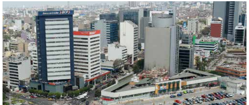
En diciembre, el sector de minería repuntó un 22.36 % interanual.

Para todo el 2015, las estimaciones de crecimiento fluctuaron entre un 3.1% y un 2.8%, todos por debajo del crecimiento potencial del tercer productor mundial de cobre. La economía del país creció un 2.4% en el 2014. "El empuje (en todo 2015) se dio por el