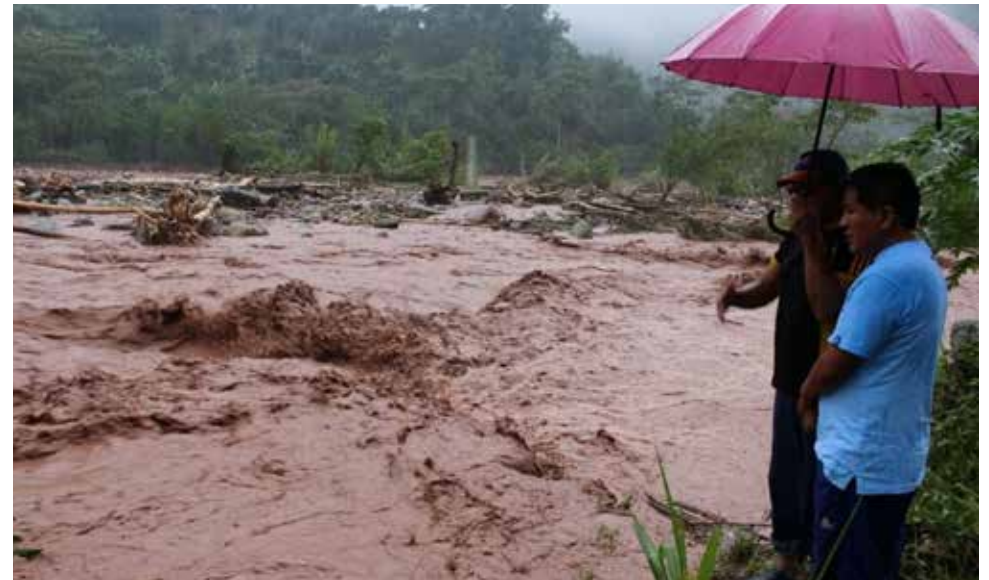
Se pronosticó para la segunda quincena un incremento de las temperaturas.

Detalló que se espera que esta situación continúe y luego de una pausa de mañana,