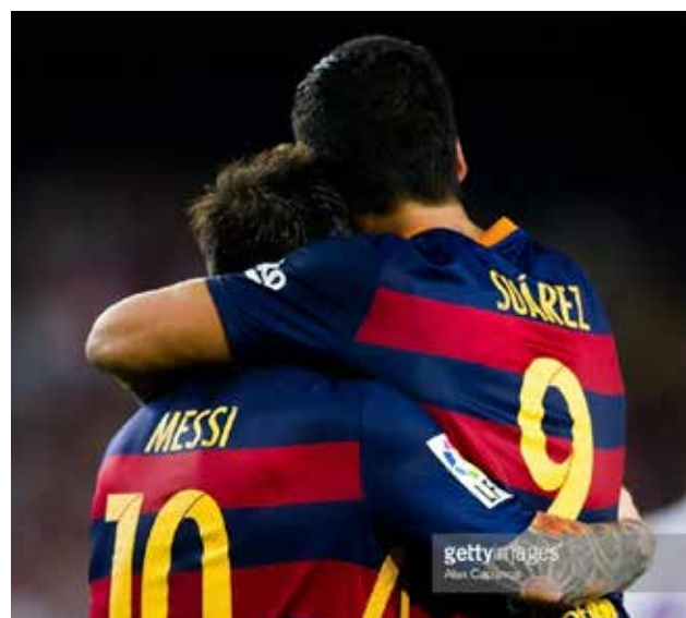
Se impuso la ley de la MSN -Messi-Suárez-Neymar.