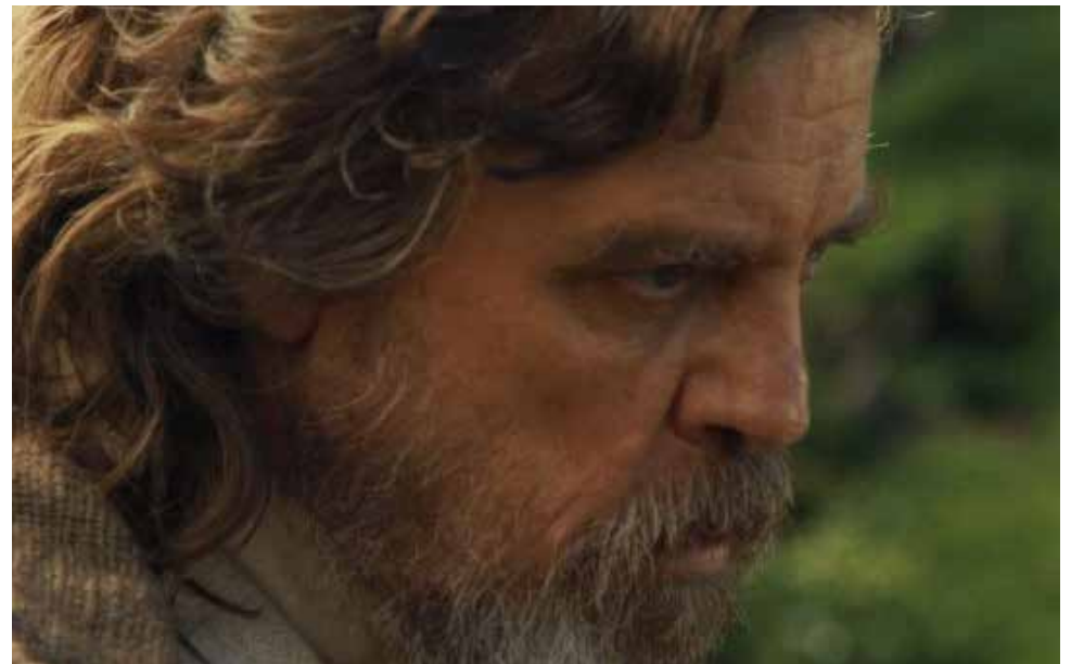
Este avance superó las 300 mil vistas en YouTube en minutos.

El elenco de esta nueva entrega incluye a actores como Mark Hamill, Carrie Fisher, Adam Driver, Daisy