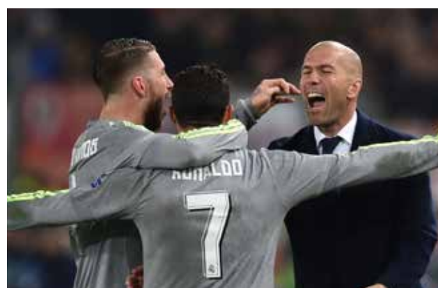
El triunfo de los madridistas fue guiado por Zidane.

El Real Madrid venció de visita 2-0 al AS Roma, en el Estadio Olímpico, por los octavos de final de la Liga de Campeones; los madridistas deberán cerrar la llave el próximo 8 de marzo en el estadio Santiago Bernabéu. Tras un inicio como técnico bastante aceptable en el campeonato español, el salto a Europa ya no tiene red para el francés, que ha tenido un mes y medio para aplicar su juego y sus métodos, el tiempo transcurrido desde el cese de Rafael Benítez como técnico madridista a principios de enero y la llegada al puesto del debutante Zidane.