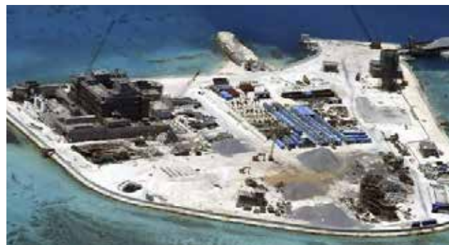
El ministro chino, Wang Yi, no desmintió explícitamente el despliegue de misiles.

China desplegó misiles tierra-aire en la principal isla del archipiélago Paracelso, en el mar de China meridional, al tiempo que Beijing reivindicó el derecho a construir sistemas de "autodefensa" en esa región estratégica. El ministro taiwanés de Defensa confirmó la existencia del dispositivo al reaccionar a un reportaje de la cadena estadounidense Fox News que daba cuenta de la instalación de misiles tierra-aire en la isla de Woody (llamada Yongxing en chino).