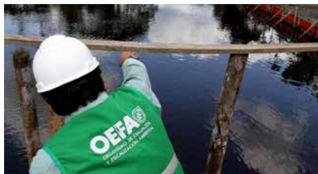
Tiene un plazo de siete días para dar cumplimiento a la medida preventiva.

El Organismo de Evaluación y Fiscalización Ambiental (OEFA) ordenó a Petroperú S.A. que realice el reemplazo del ducto en aquellas secciones del oleoducto norperuano que han sufrido un deterioro severo o significativo. Mediante la Resolución Directoral N° 012-2016-OEFA-DS, se indica que en el marco de lo establecido en su Programa de Adecuación y Manejo Ambiental (PAMA), Petroperú ejecute también el mantenimiento efectivo, inmediato e integral en aquellas secciones del ducto que