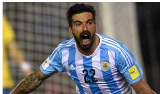
Otros destacados fichajes de la Liga china son Jackson Martínez y Alex Teixeira.

El Hebei Fortune publicó en WeChat, la red social más popular de China, un escueto