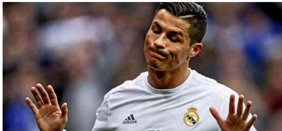
"He acostumbrado mal a la gente. Ojalá siga de mal hasta final", dijo Ronaldo.

"Es normal. O yo lo veo así. Cuando acostumbras mal a un hijo y le das todo y, de pronto, dejas de hacerlo, llora.