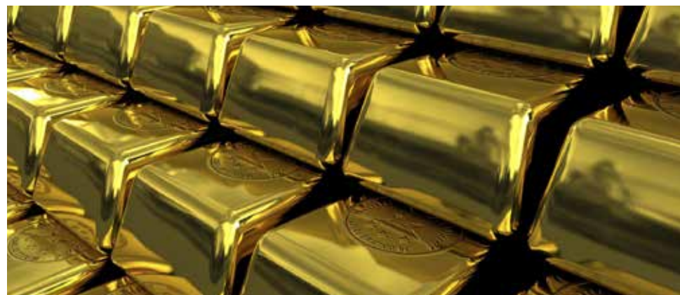
Oro tocó máximos de 1,260 dólares luego de escalar 200 dólares en un mes.

El oro al contado operaba en 1,201.69 dólares la onza a las 1020 GMT, un alza de 0.1% pero lejos de un máximo previo de 1,212.20 dólares. El oro para abril en Estados Unidos cedía 0.5%, a 1,202.40 dólares. Los precios del oro