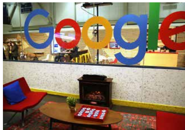
Aquellos que no deseen mudarse aún podrán ver, descargar y borrar fotos.

"Creemos que podemos crear una experiencia mucho