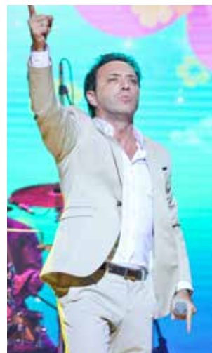
Unipersonal "El amor en los tiempos de Galdos" en el Teatro Peruano Japonés.

A lo largo de más de dos horas de show, producido