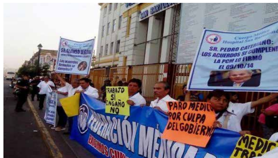
También está la Asociación Nacional de Médicos Residentes del Perú.