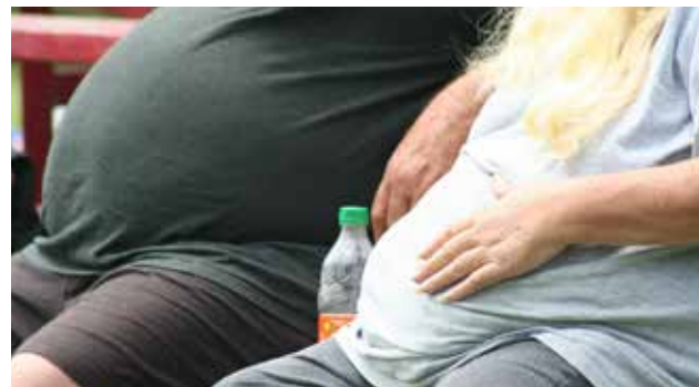
La obesidad es considerada dentro del grupo de enfermedades crónicas.

Sin embargo, el trabajo destaca que existen más elementos que podrían condicionar a desarrollar cáncer,