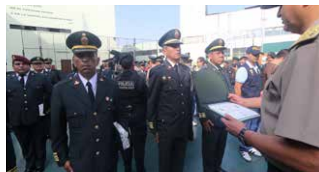
Entre los destacados se mencionó la captura de "Los malditos de Huáscar".

Esta ceremonia se cumplió en el patio de la División de Operaciones Especiales