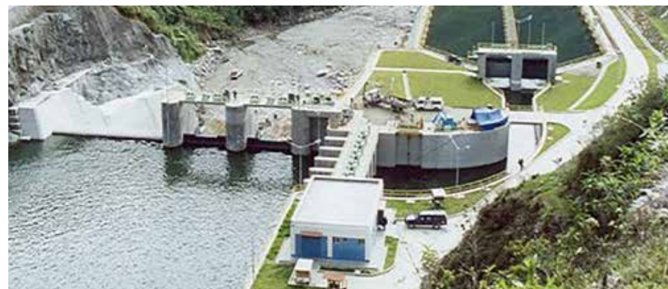
En la subasta el Grupo Enel ha participado para renovables Enel Green Power Perú.

El beneficio de este proyecto es que aprovecha el caudal turbinado de la CH Huampaní para generar una producción media de 5.4 gigavatios hora/año (Gwh/año) para HER Huampaní.