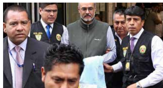
La próxima semana se estaría evaluando el caso en la sala de apelaciones.