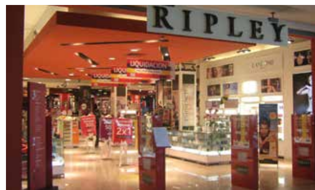
Ripley sufrió pérdidas cercanas a los 27 millones de dólares en Colombia.

La empresa de comercio minorista Ripley, una de las más grandes de Chile, anunció el cierre de sus operaciones en Colombia ante el debilitamiento de la economía de ese país. “En el escenario macroeconómico de Colombia surgieron cambios que no eran previsibles en la época en que se decidió invertir en ese país”, indicó un comunicado de Ripley a la Superintendencia de Valores y Seguros de Chile. Añadió que “no se produjeron los resultados esperados ni los niveles de participación de mercado necesarios para ga-