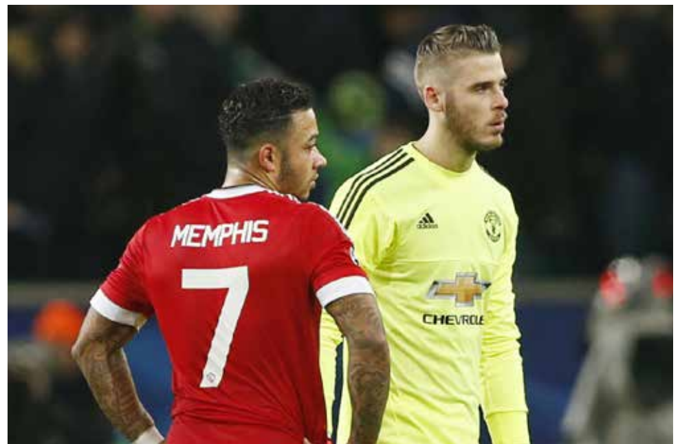
Manchester United fue sorprendido por el Midtjylland en la Europa League.

En la recta final (77) el nigeriano Paul Onuachu cul-