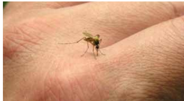
En el caso de Brasil y Colombia, los gobiernos han iniciado intensas

Según los cálculos y ante la evolución de la situación, la OMS indicó que, del importe