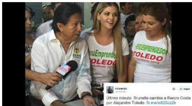
Expresidente destacó la belleza de anfitriona.