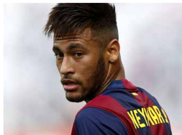
Neymar también ha expresado que quiere jugar Río 2016.

El Barcelona le ha pedido a la CBF que se haga cargo del sueldo de Neymar durante