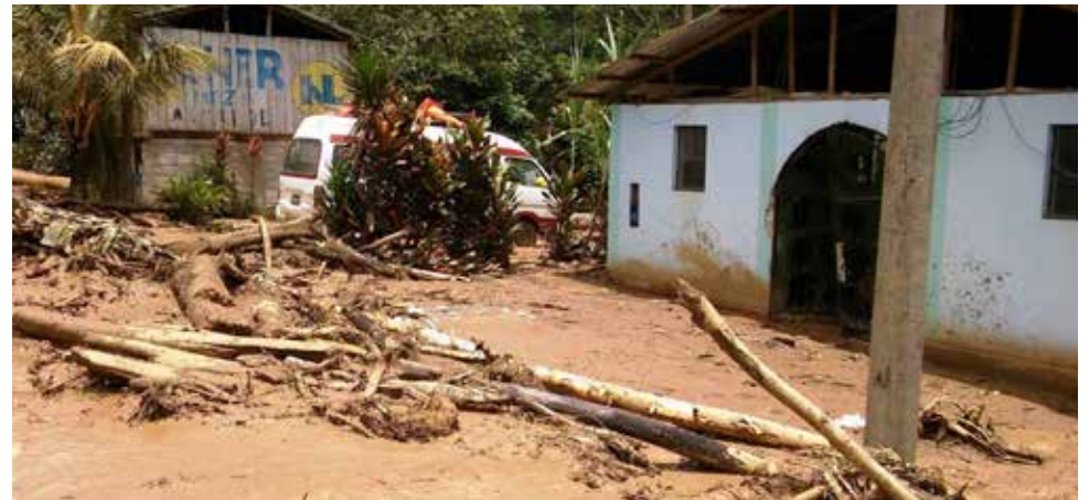
La comuna provincial de Satipo dispuso maquinarias para desbloquear la carretera.

"Los representantes del comité de Defensa Civil de Pampa Hermosa hacen lo humanamente posible para llegar a pie a la zona, pero