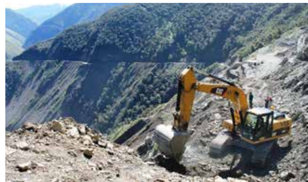
También ejecutarán proyectos de infraestructura educativa y de salud.

El gerente general del Gobierno Regional de Puno, Ernesto Calancho Mamani, informó que la citada entidad pública ejecutará proyectos de inversión pública por 127 millones de soles en diversas localidades del departamento. La mayor parte del presupuesto regional está destinada a proyectos viales como el asfaltado de la carretera Desaguadero-Pizacoma, que comprende 65 kilómetros y debe iniciar su ejecución el lunes 22 de febrero, con una inversión de 65 millones. Entre otras obras estratégicas, se encuentran el