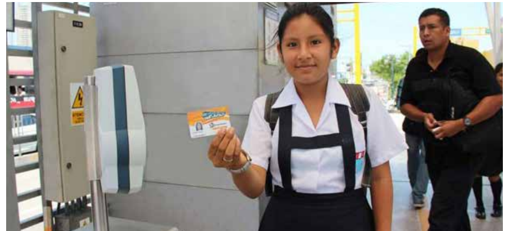
Alrededor de 20,000 menores usan diariamente este moderno sistema.

Además, es requisito indispensable presentar la constancia de matrícula del año en curso para el registro