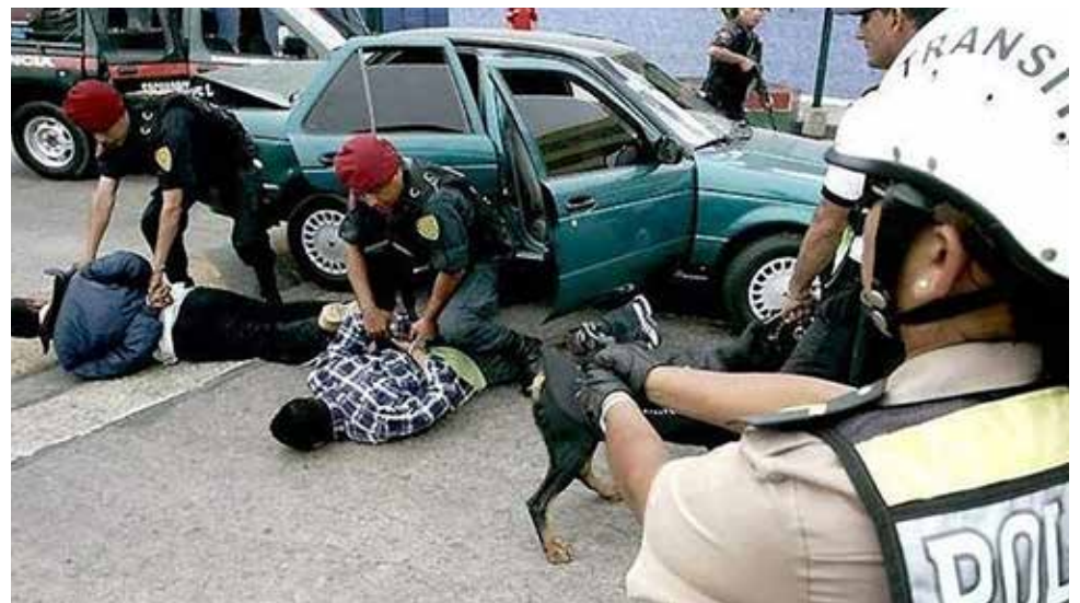
Dichas recompensas serán entregadas en un plazo de 30 días hábiles.

La norma precisa que a todos los colaboradores se les asignará un código secreto y será una comisión evaluadora la que determinará el monto de la recompensa.