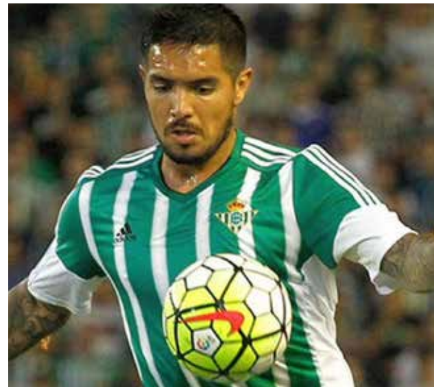
"Loco" todavía recuerda con mucha nostalgia a Universitario de Deportes.

Sobre su último gol ante Deportivo La Coruña la pasada fecha por Liga BBVA, Vargas no le tomó mucha importancia, indicando que son