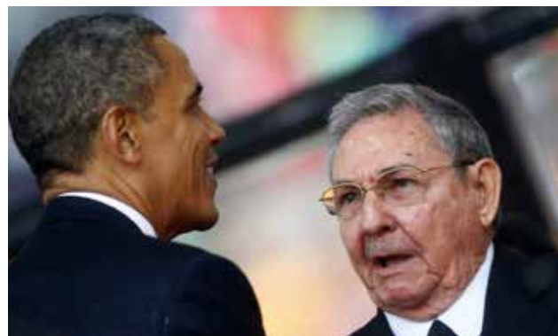
Ambos países firmaron un acuerdo que reanuda la aviación comercial.

Será el primer presidente de Estados Unidos que visita la isla luego de 88 años.