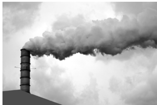
El equipo evaluó la calidad del aire con datos recogidos entre el 2010 y el 2013.

El aumento de la contaminación y la baja calidad del aire en general incrementa el número de accidentes cerebro vasculares (ACV), comúnmente llamados derrames cerebrales, según un estudio presentado en la conferencia internacional de la Asociación Americana de Accidentes Cerebrales. Los investigadores estudiaron los casos de Estados Unidos y China por ser "los mayores emisores de gases de efecto invernadero y responsables, hasta ahora, de un tercio del calentamiento global", según el director del estudio, Longjian Liu, profesor asociado de la Uni-