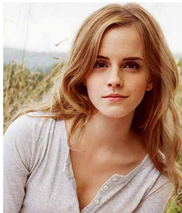
Según confiesa quería aparentar ser una adolescente "mucho más cool".

Watson, embajadora de Buena Voluntad de ONU Mujeres, se ha involucrado recientemente en campañas como "HeForShe", que busca