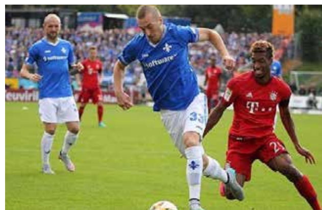
Los números hablan a favor del Bayern Múnich, que no ha recibido ni un gol.

El puntero alemán, Bayern Múnich, recibe al ascendido Darmstadt por la vigesimosegunda fecha de la Bundesliga en un partido que le servirá de prueba para el gran choque de la próxima semana ante la Juventus de Turín. En su carrera a la conquista del cuarto título consecutivo de la Bundesliga, el equipo de Josep Guardiola tratará de buscar el equilibrio entre un buen juego y un resultado eficiente para preservar fuerzas de cara al choque del martes en Turín por los octavos de final de la Champions League.