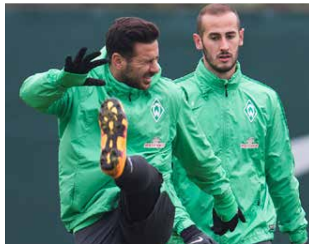
Pizarro extenderá sus goles ante Ingolstadt por la fecha 22 de la Bundesliga.

Werder Bremen continúa en una situación compleja en la Bundesliga. Se ubica en el décimo sexta casilla con 20 unidades. En esa posición