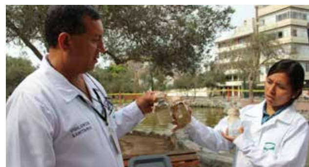
Se llevan a cabo trabajos de mantenimiento integral en las dos lagunas.

Los resultados arrojaron la presencia de sulfato de cobre en el agua y sus nefastas consecuencias de toxicidad en los peces. Igualmente, a