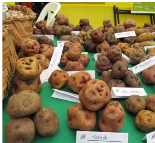
Muchas de las papas seleccionadas pasarán las pruebas.

Tras rigurosas evaluaciones, unas cien variedades de papa peruana fueron seleccionadas para comenzar, en las próximas semanas, las duras pruebas que determinarán si son aptas para viajar y reproducirse en las condiciones extremas de Marte. Este centenar de especies fueron elegidas de entre un total de las 4.500 variedades registradas el Centro Internacional de la Papa (CIP) en Lima, institución que, junto a la Agencia Espacial de Estados Unidos (Nasa), iniciará en un mes en Perú una investigación pionera a nivel mundial: determinar si es posible cultivar este tubérculo en el planeta rojo, el