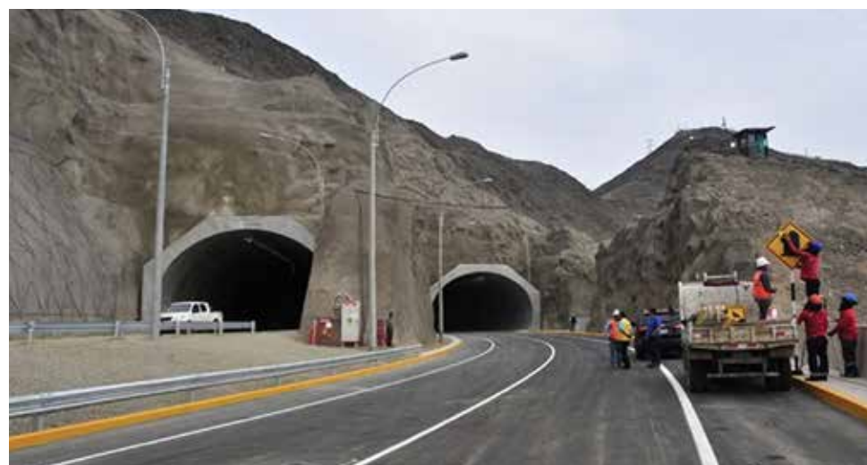
Expertos evalúan el tipo de transporte público que usará dichos túneles.

Se estimó que con los túneles, que se abrirán totalmente las 24 horas, el actual flujo de 15 mil vehículos registrado por día se incrementaría en más de 20 mil. Destacó, asimismo, que estas obras cuentan también