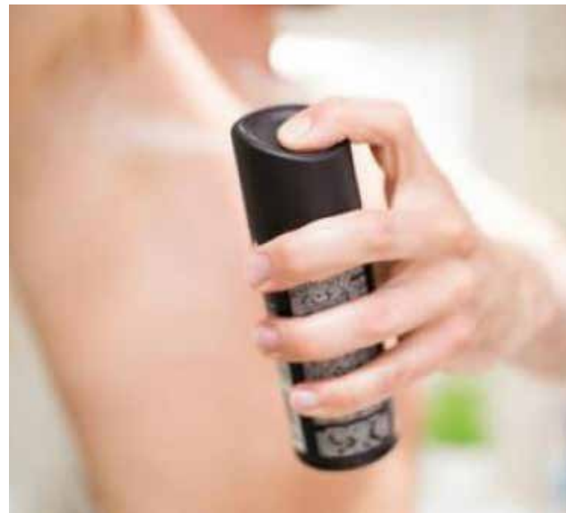
Para evitar el mal olor que se origina con la transpiración.

Las millones de glándulas que tenemos en nuestro cuerpo bombean varios litros de sudor al día, muchas veces en exceso. Y los desodorantes y antiperspirantes son nuestra primera arma para reducir el mal olor y canti-