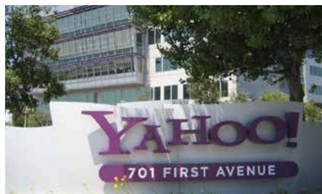
Yahoo se propone reducir sus gastos en más de 400 millones de dólares.

Yahoo ya había anunciado que consideraba diferentes opciones mientras ponía en marcha una reestructura general, pero la formación de esa comisión acelera decisio-