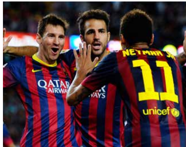
Triunfo en El Molinón ha aumentado la racha de victorias del Barcelona.

bro no reservará nada para compromisos a priori más terrenales, como el siguiente en Éibar, y saldrá ante Barcelona con todo lo que tiene disponible, que no es mucho, ya que cuenta con los justos para confeccionar la convocatoria. Las reiteradas bajas por lesión de Las