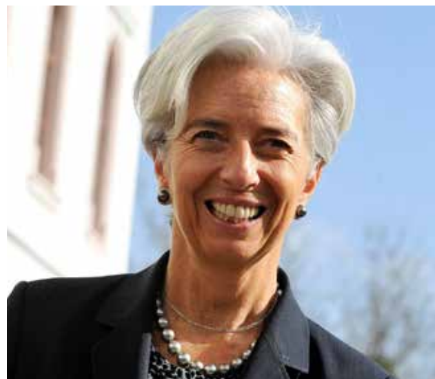
Economista es apuntada como responsable por recuperar la reputación del FMI.

"Estoy encantada de tener la oportunidad de conducir el FMI, como Directora Gerente, por un segundo término de cinco años, y agradezco la continuada confianza y apoyo del Directorio del Fondo y de sus 188 países