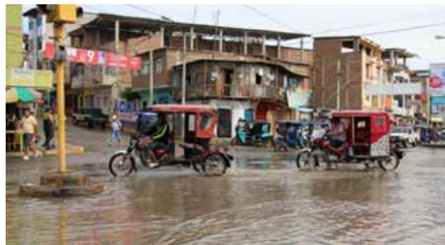
El niño continuaría con magnitud fuerte por lo menos hasta marzo.

El comité multisectorial encargado del Estudio Nacional del Fenómeno El Niño (Enfen) informó que se observan las primeras manifestaciones del arribo a la costa peruana de la onda kelvin cálida esperada, cuya influencia se observa con la presencia de lluvias en regiones del norte del país. De acuerdo con el comunicado del comité multisectorial, dicho arribo se suma al calentamiento estacional, por lo que es probable que facilite la ocurrencia de algunos episodios de lluvias