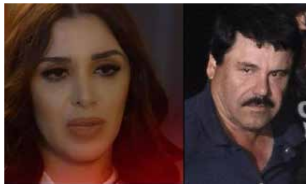
'El Chapo' fue capturado por primera en 1993, en Guatemala, y trasladado a México.

La esposa de Joaquín 'El Chapo' Guzmán rompió su silencio para salir en defensa de su marido en una entrevista exclusiva con Telemundo, en la que dice temer por su vida y denuncia que no se respetan sus derechos. La cadena de televisión en español difundió algunos fragmentos de la entrevista con Emma Coronel Aispuro, promocionada con el título de "La Reina de El Chapo". "Temo por su vida", dice la esposa del jefe del cartel de Sinaloa, quien se escapó de una