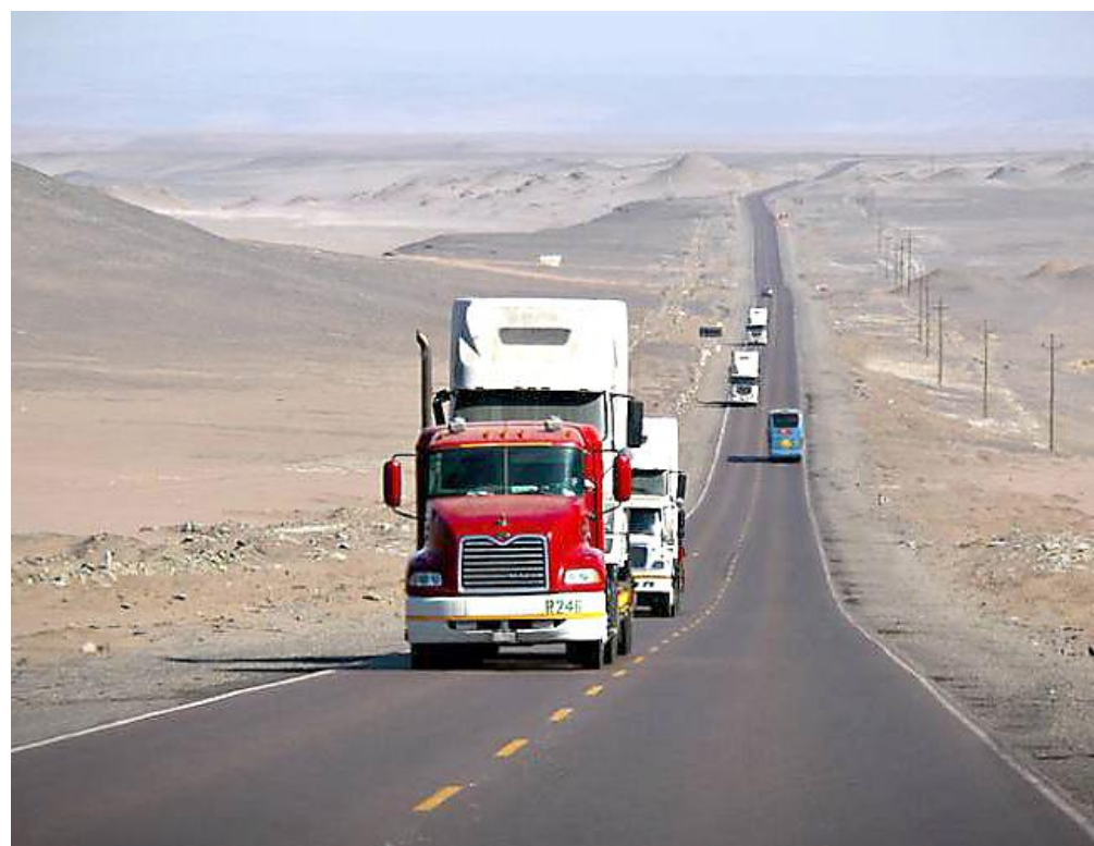
Se informó que los asaltos suceden entre los kilómetros 79 y 98.