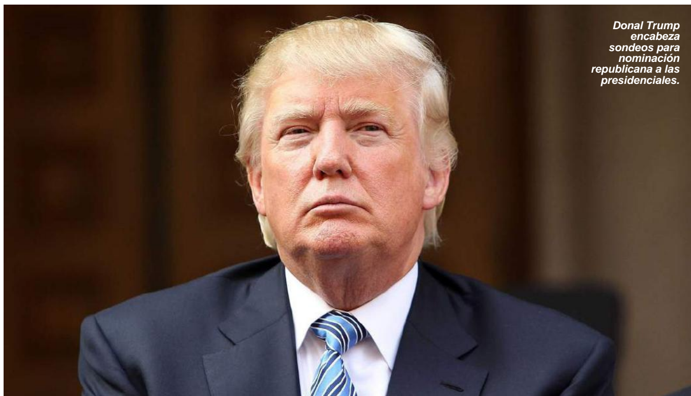
Donald Trump encabeza sondeos para nominación republicana a las presidenciales.

LLEVA MESES ENFRENTADO A TELEVISORA POR SUPUESTA PARCIALIDAD.