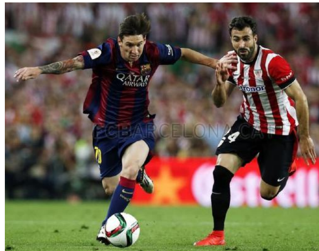
Barcelona de la mano de Messi, sigue dando buenos frutos.

Un tanto más clasificaba virtualmente al Athletic de Bilbao para la siguiente ronda del 'torneo del KO' y el Bar-