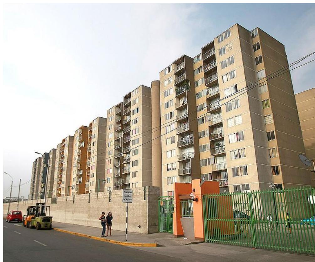
El crecimiento inmobiliario se concentra en proyectos de viviendas con precios medios.

En tanto, los departamentos ubicados en los distritos