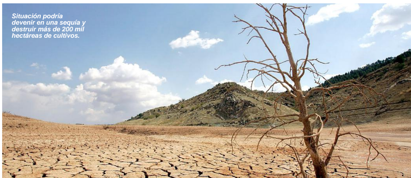
Situación podría devenir en una sequía y destruir más de 200 mil hectáreas de cultivos.

PUNO. SE DICTÓ ESTA MEDIDA POR LOS SIGUIENTES 90 DÍAS