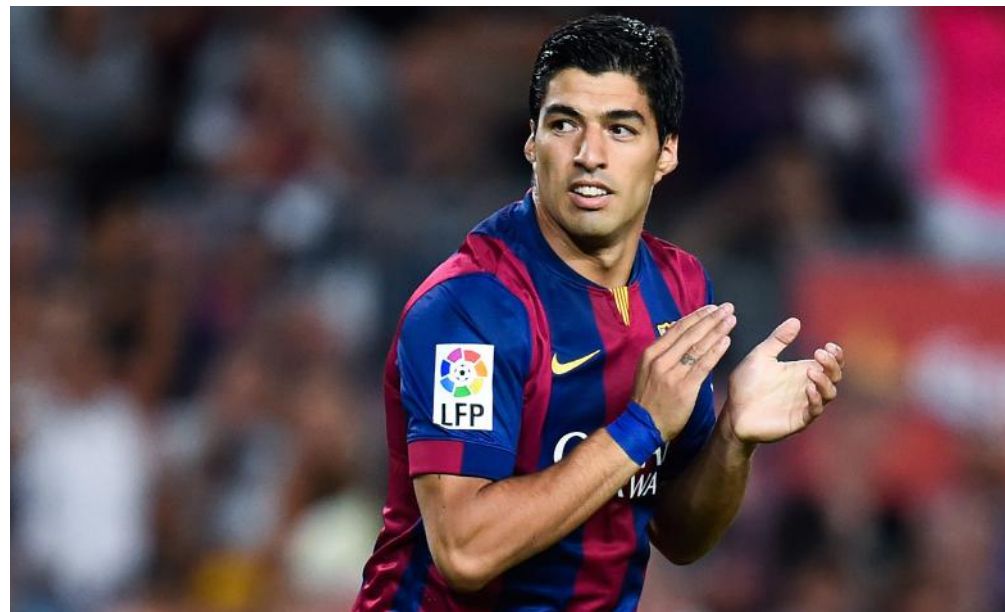
Barcelona le lleva siete puntos al Real Madrid, que juega hoy contra el Espanyol.

El Atlético de Madrid empezó bien su partido contra el Barcelona al adelantarse en el marcador con un gol de Koke Resurrección en el minuto 10, que remató un centro desde la banda de Saúl Níguez. El primer disparo a puerta del Barcelona llegó en el minuto 29 por medio del uruguayo Luis Suárez, en la jugada anterior en la que empató Leo Messi (30), al rematar un centro desde la izquierda de