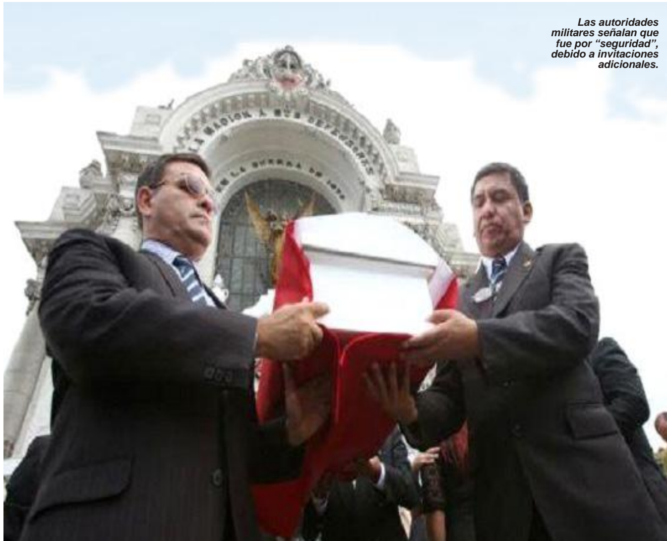
Las autoridades militares señalan que fue por "seguridad", debido a invitaciones adicionales.