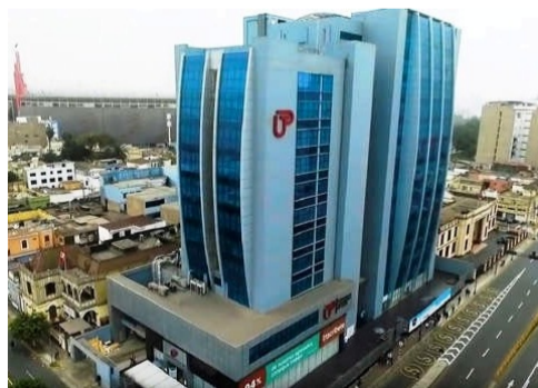
Municipalidad Provincial de Ica.